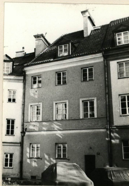
ELEWACJA OD PODWÓRZA, DŁD-ZACH.

Wkładkę założył: ST. MICHNO czerwiec 1980 (imię, nazwisko, data)