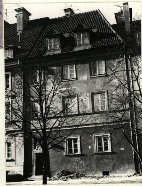
ELEWACJA OD STRONY RYNKU NOWEGO MIASTA, IVsch.