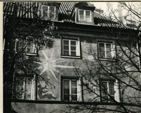
ELEWACJA OD RYNKU, WSCH. FRAGMENT Z DEKORACJĄ PŁASTYCZNĄ.

WARSZAWA, PLAN NOWEGO MIASTA / FRAGMENT / OPRACOWANY NA PODSTAWIE PLANU KOROT'A Z OK. 1822 R. /w/ „GZKICE NOWOMIEJSKIE” SKALA 1:2000