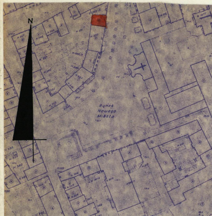
WARSZAWA, RYNEK NOWEGO MIASTA 27 POMIAR wg WPG 1972r skala 1:2000