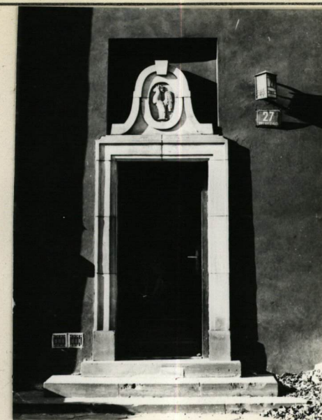
ELEWACJA OD RYNKU, WEJŚCIE