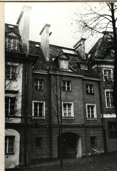
ELEWACJA OD DZIEDZIŃCA

Wkładkę założył: ST. MICHNO, czerwiec 1980 (imię, nazwisko, data)