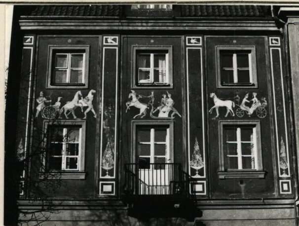
ELEWACJA OD RYNKU NOWEGO MIASTA FRAGMENT Z POLICHROMIĄ

WARSZAWA, PLAN NOWEGO MIASTA /FRAGMENT/ OPRACOWANY NA PODSTAWIE PLANU KORJOT'A Z. OK. 1822 R. /w/ „SZKICE NOWO-MIEJSKIE” SKALA 1:2000