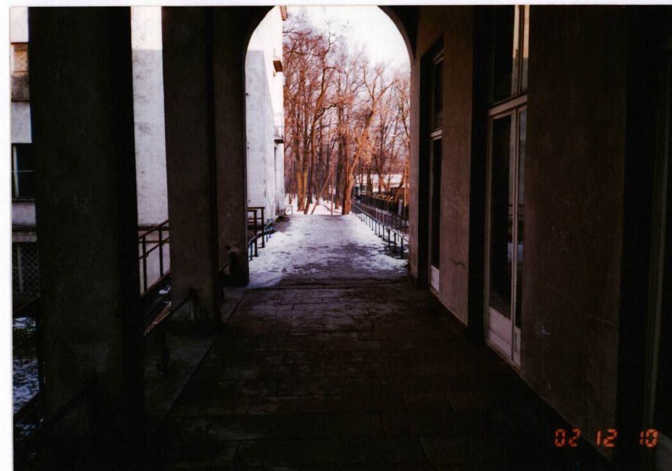
FOT. 6, Widok podcienia elewacji północnej, grudzień 2002.