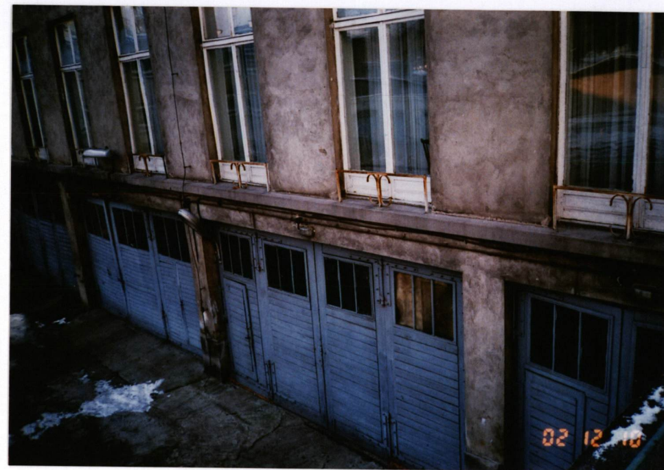
FOT. 4, Widok elewacji zachodniej. stan grudzień 2002.