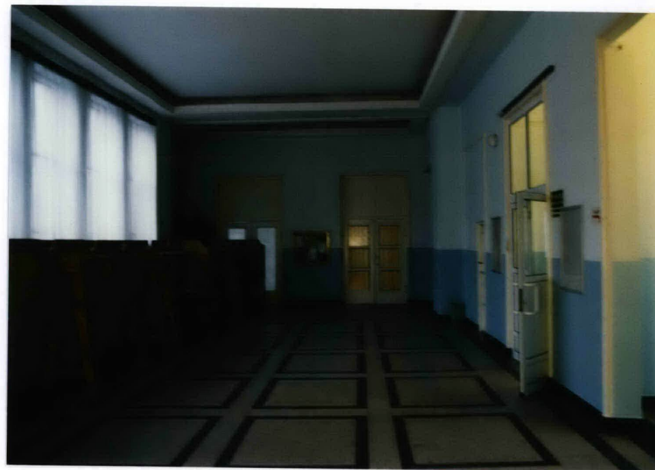
FOT. 12, Widok drzwi w elewacji północnej, stan grudzień 2002. FOT. 13, Widok hallu głównego, stan grudzień 2002.