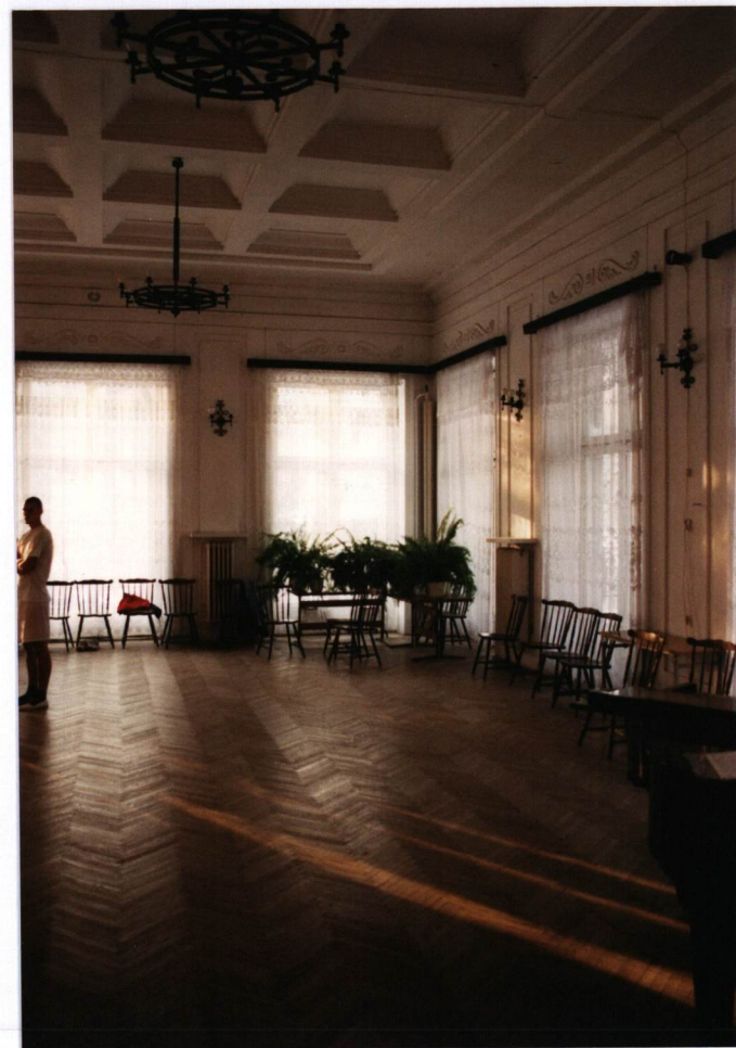
FOT. 16 Fragment fryzu w sali jadalni, stan grudzień 2002. FOT. 17 Widok drugiej sali jadalnej, stan grudzień 2002.