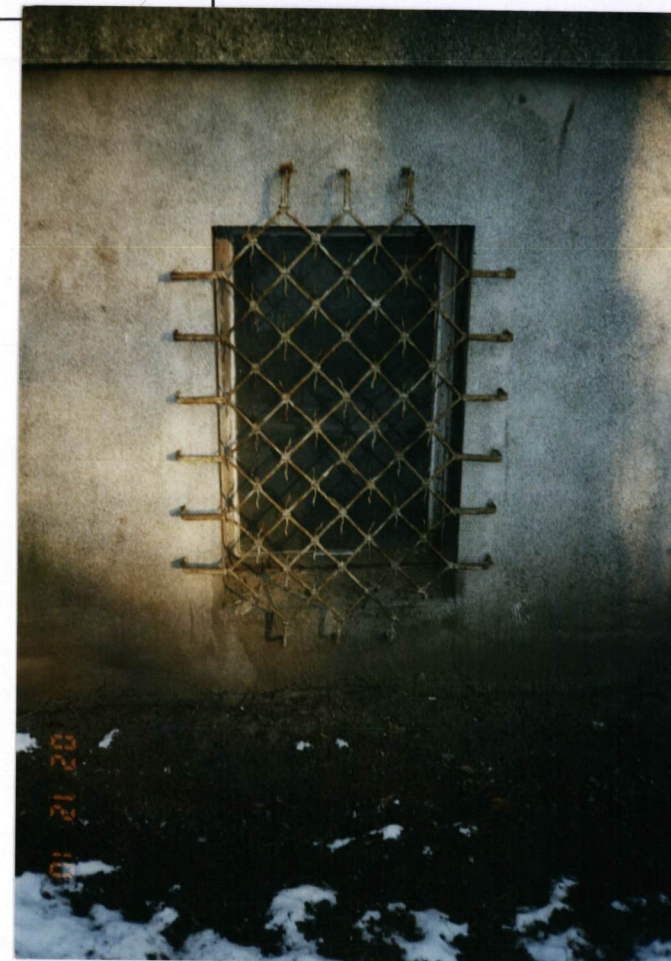
FOT. 11 Widok okna do piwnicy, stan grudzień 2002.