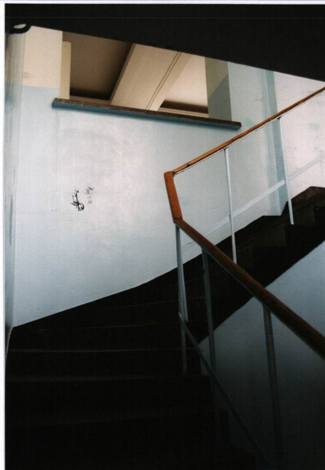
FOT. 18 Widok klatki schodowej, stan grudzień 2002.

mgr WANDA ZAWISTOWSKA- ŚLEBNODA, GRUDZIEŃ 2002