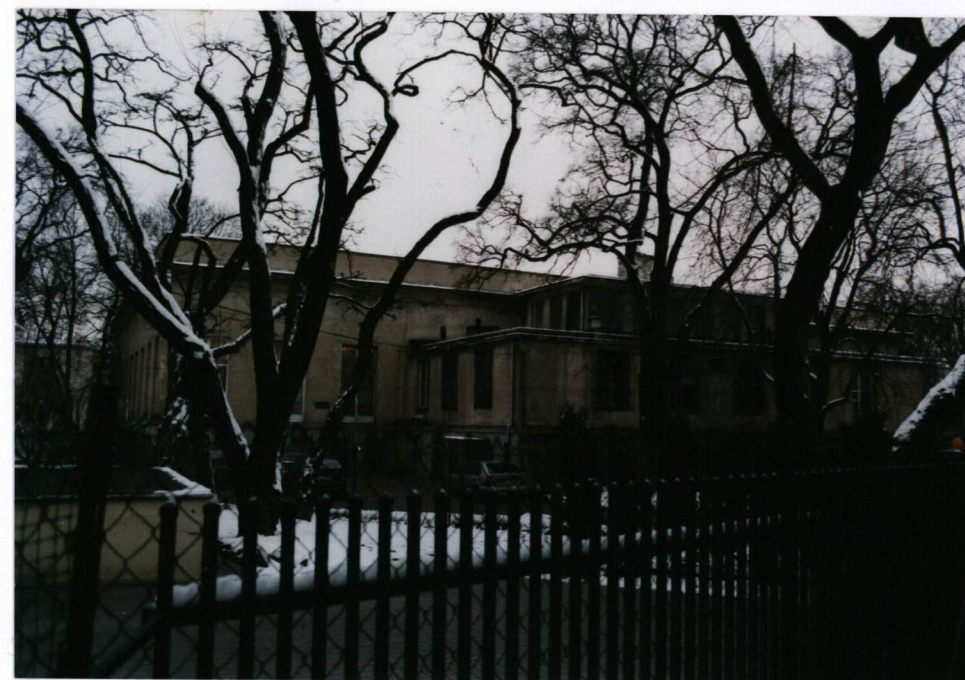
FOT. 2, Widok elewacji południowej, grudzień 2002.