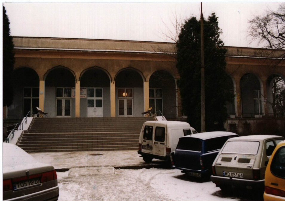
FOT. 2 Widok elewacji północnej Stołówki Głównej, stan grudzień 2002.