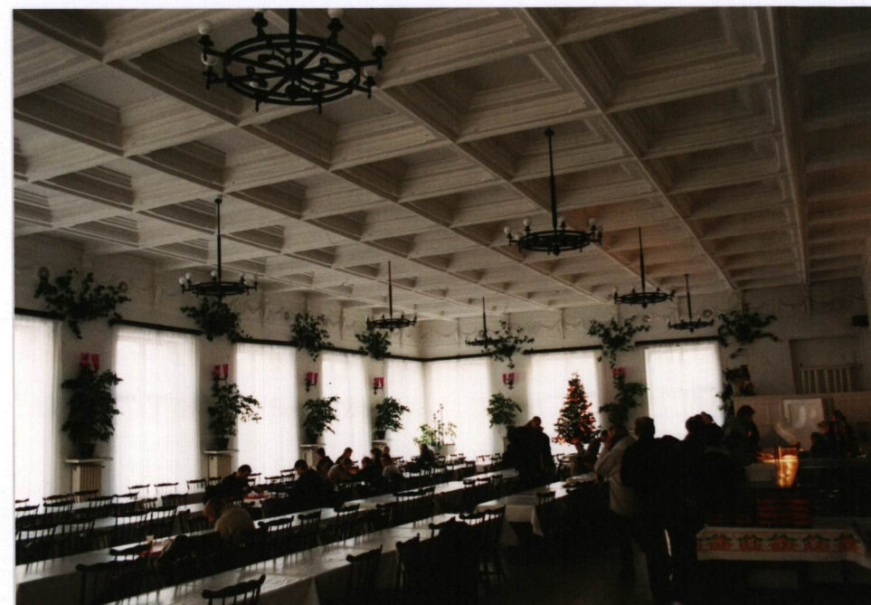
FOT. 14 Widok jadalni, grudzień 2002.