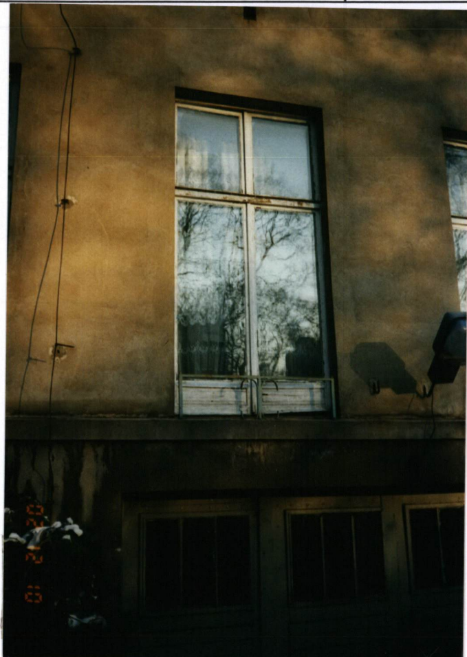
FOT. 10, Widok okna I kondygnacji elewacji zachodniej, grudzień 2002.