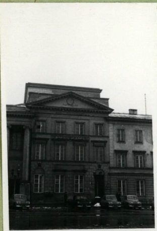
Kasownik w wałej zabudowie ulicznej.