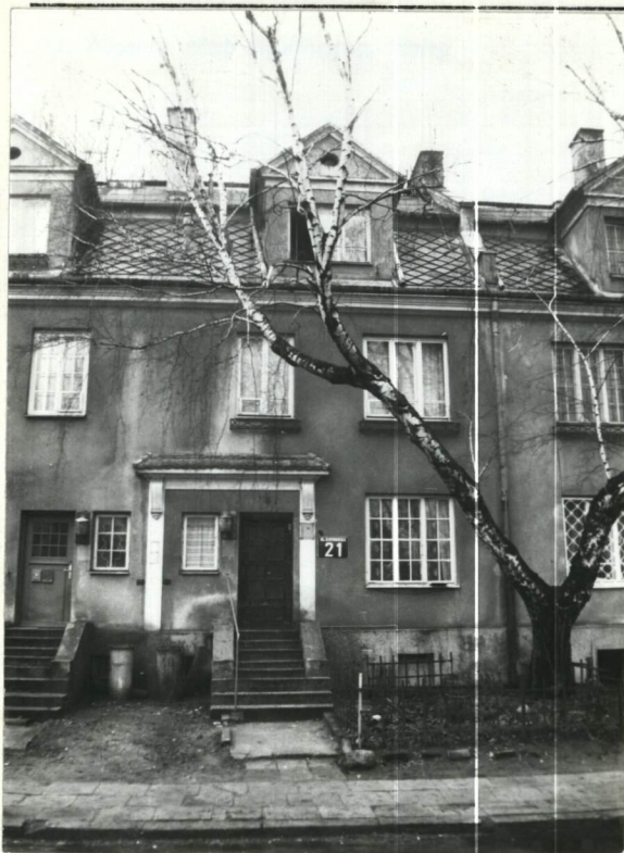
FASADA (ELEWACJA WSCH.)