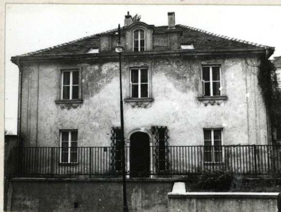
ELEWACJA OD UL. GÓRNOŚLASKIEJ, pn.

WARSZAWA, UL. GÓRNOŚLASKA 43 POMIAR wg WPG 1972 R. SKALA 1:2000