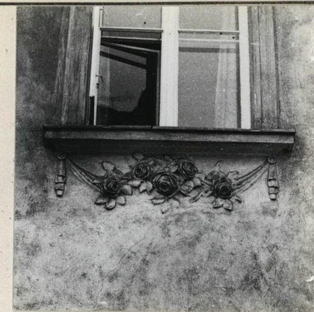
ELEWACJA OD STRONY PŁN. DETAL POD OKNEM.

Wkładkę założył: ST. MICHNO CZERMIEC 1980 r. (imię, nazwisko, data)