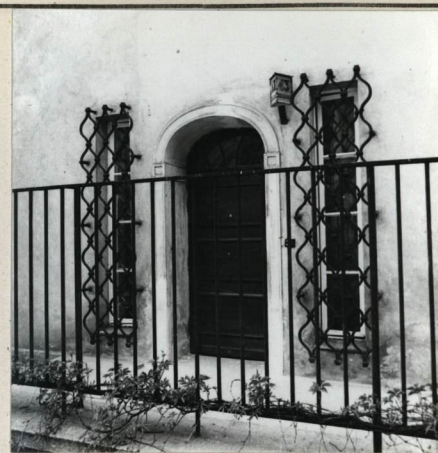
ELEWACJA OD STRONY PÓŁNOCNEJ WEJŚCIE GŁÓWNE