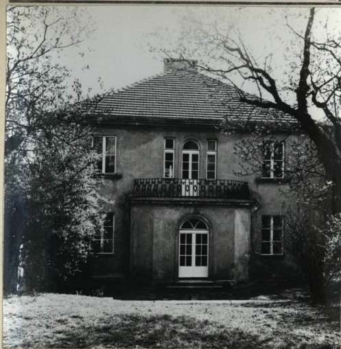
ELEWACJA OD STRONY OGRODU, ZACH.

3. Zawartość wkładki (nazwa obiektu lub materiału uzupełniającego) Fotografie