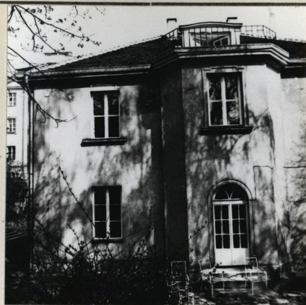
ELEWACJA OD STRONY OGRODU POŁUDNIOWA