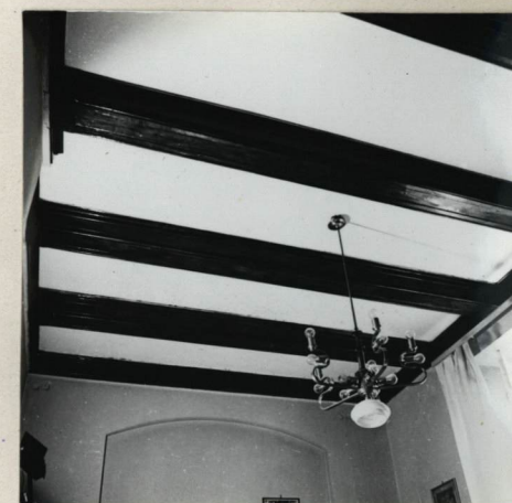
FRAGMENT WNETRZA, STROP