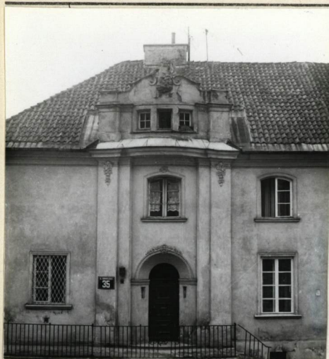
ELEWACJA OD ULICY, PÓŁNOCNA

3. Zawartość wkładki (nazwa obiektu lub materiału uzupełniającego) Fotografie