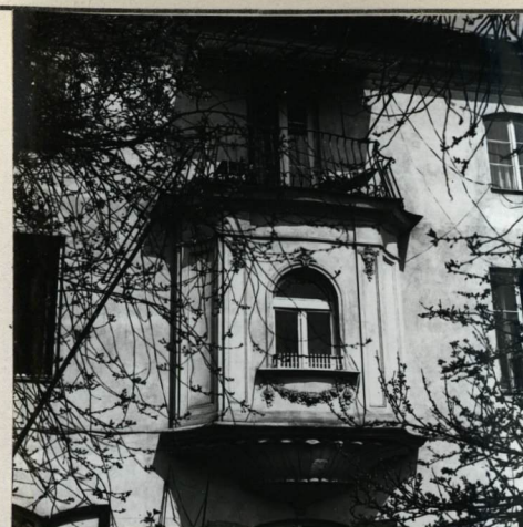
ELEWACJA OD OGRODU, PÓŁDNIOWA