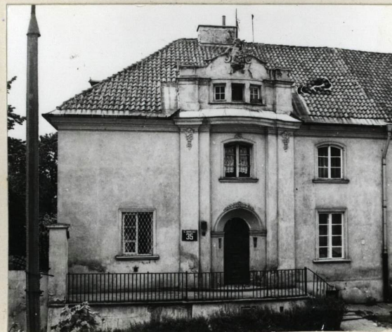
ELEWACJA OD UL. GÓRNOŚLĄSKIEJ, PN