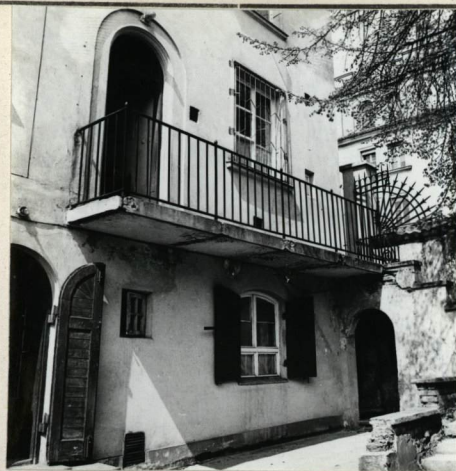
ELEWACJA OD OGRODU, WSCHODNIA