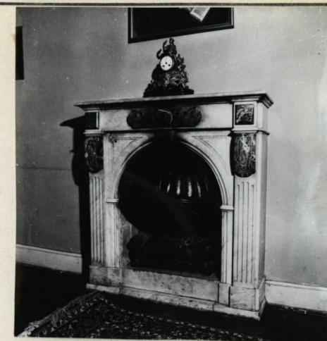
FRAGMENT WNETRZA, KOMINEK