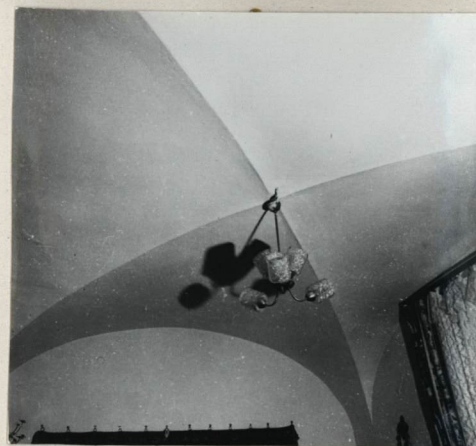
FRAGMENT WNETRZA, SKLEPIENIE