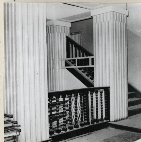
WNĘTRZE, HALL GŁÓWNY.

Wkładkę założył: ST. MICHNO CZERWIEC 1980 r. (imię, nazwisko, data)