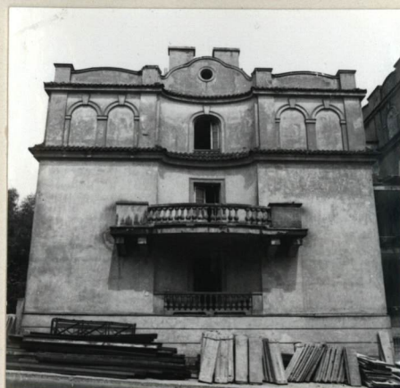
ELEWACJA FRONTOWA, SKRZYDŁO ZACHODNIE