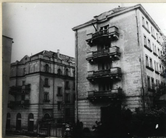
WIDOK OD STRONY PŁN-ZACH