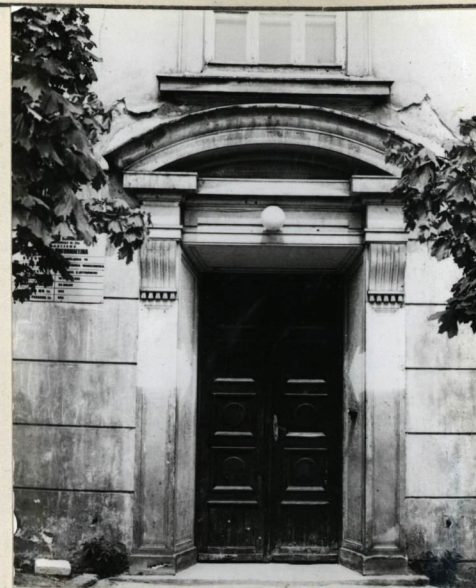
ELEWACJA FRONTOWA, PŁD. POR- TAL WEJŚCIOWY.