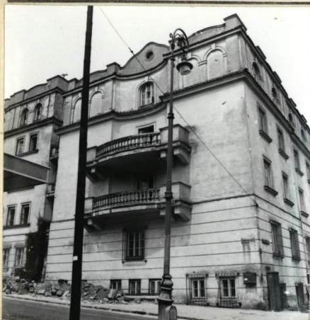
WIDOK OD UL. GÓRNOŚLĄSKIEJ PŁD-WSCH.

3. Zawartość wkładki (nazwa obiektu lub materiału uzupełniającego) Fotografie