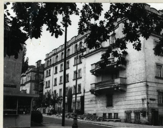
WIDOK WAROŻNY ELEWACJI - ul. G. GÓRNOŚLĄSKA - RÓG WRONSKIEGO