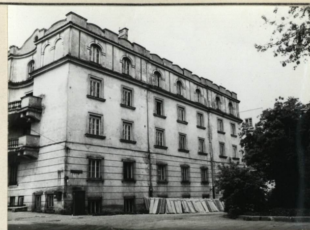
WIDOK OD UL. H. WRONSKIEGO, PŁD-WSCH.