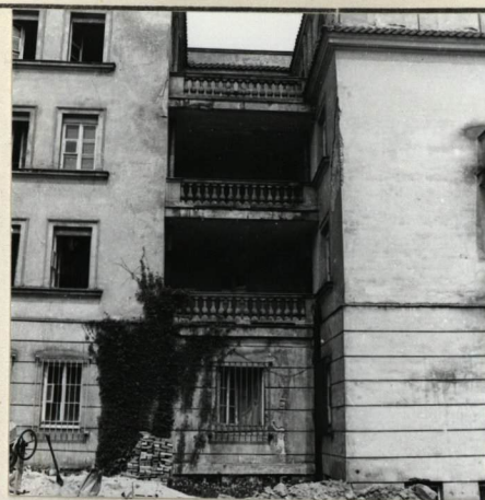
ELEWACJA FRONTOWA, LOGGIE