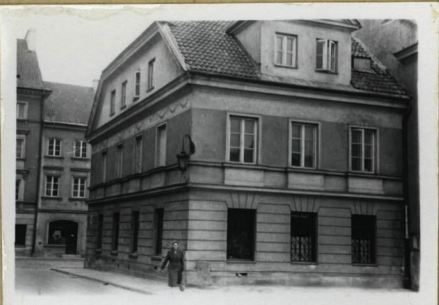
Zjednoczenie - sam. 1058, 10. 11. 57 - 12000 - kart.