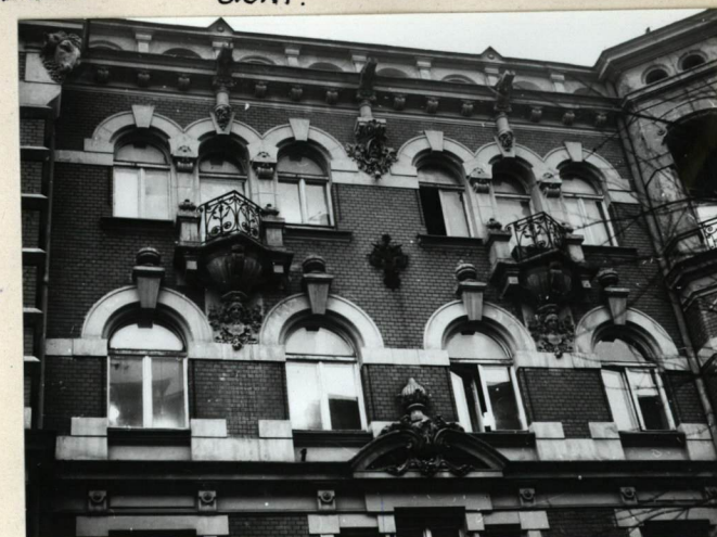
ELEWACJA FRONTOWA. FRAGMENT ŚRODKOWY.