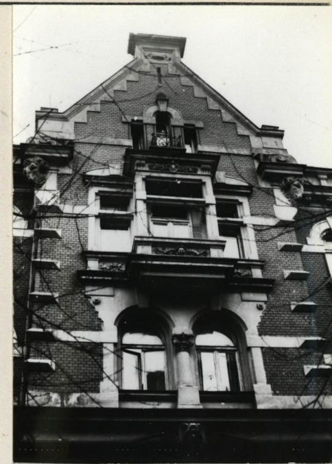
ELEWACJA FRONTOWA, GÓRNA CZĘŚĆ I ZWIĘCZENIE WYKUSZA.