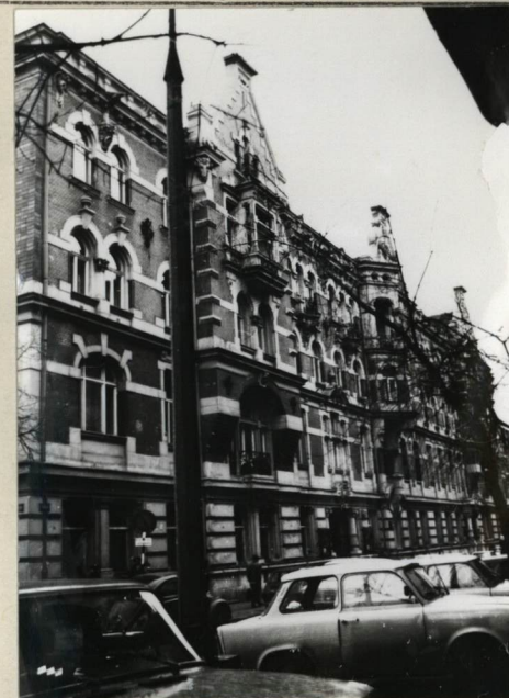
ELEWACJA OD ULICY FOKSAL