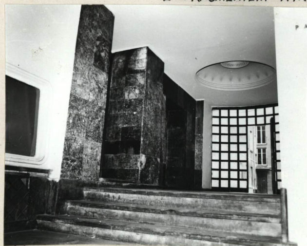
SIEN - FRAGMENT

Jedn. Wyd. Akcyd. Olsztyn zam. 1299/Ś/78 OZGrafi. ZP. Ostróda zam. 1040 n. 20000