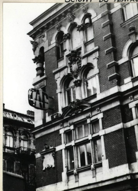
ELEWACJA WSCHODNIA, FRAGMENT