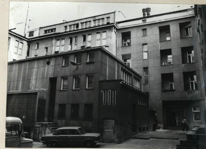
ELEWACJA TYLNA, BUDYNEK TEATRU. Wzór ODZ 1978 r.