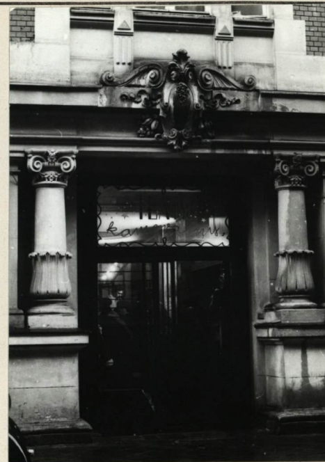
ELEWACJA FRONTOWA. PORTAL WEJ- ŚCIOWY DO TEATRU KAMERALNEGO