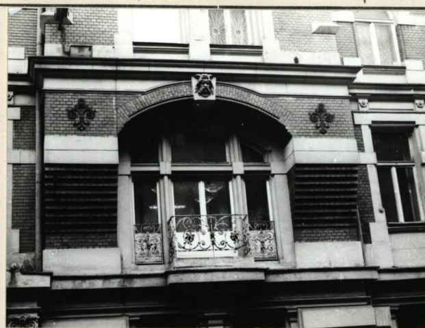
ELEWACJA FRONTOWA, FRAGMENT Z PODSTAWĄ WYKUSZA.