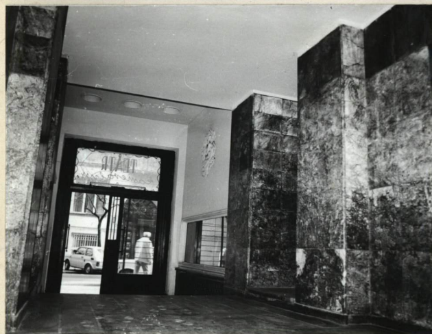
SIEN - FRAGMENT