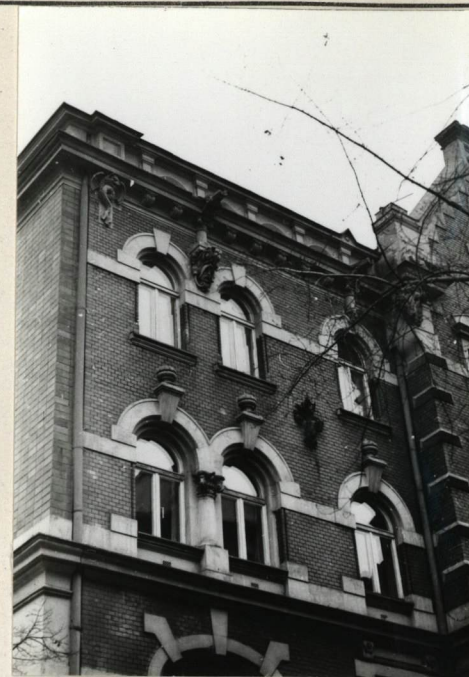
ELEWACJA FRONTOWA, STYK ŚCIANY Z FRAGMENTEM WYKUSZA