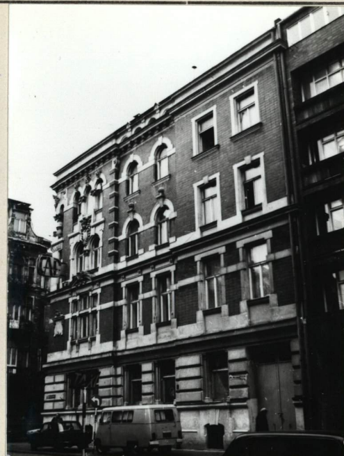
WIDOK OD UL. KOPERNIKA, PŁN-WSCH.