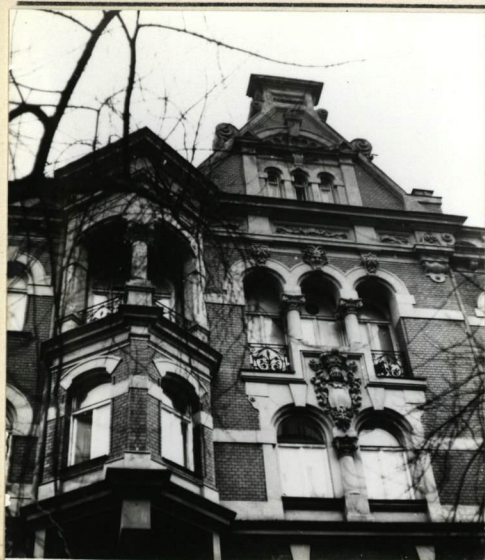
ELEWACJA FRONTOWA, FRAGMENT Z WYKUSEM I LOGGIA.

3. Zawartość wkładki (nazwa obiektu lub materiału uzupełniającego) Fotografie