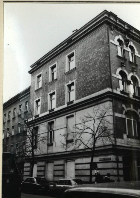
WIDOK OD UL. FOKSAŁ OD PŁD-ZACH NA ELEWACJĘ OD UL. K.J. GAŁCZYŃSKIE -GO.

3. Zawartość wkładki (nazwa obiektu lub materiału uzupełniającego) Fotografie