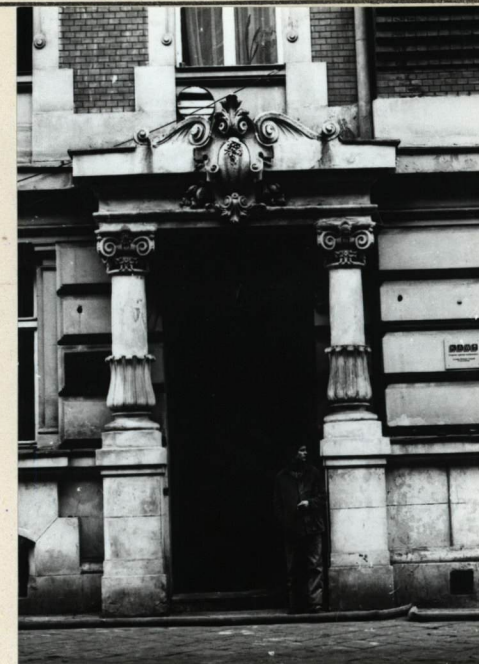
ELEWACJA FRONTOWA, PORTAL WEJŚ- CIOWY.