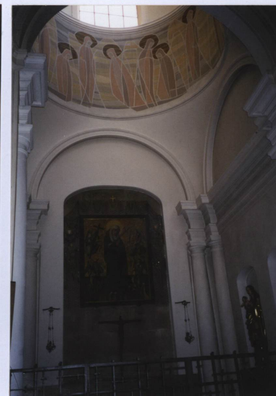
FOT. NR 13