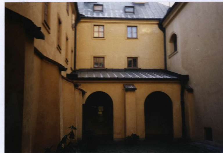
FOT. NR 9