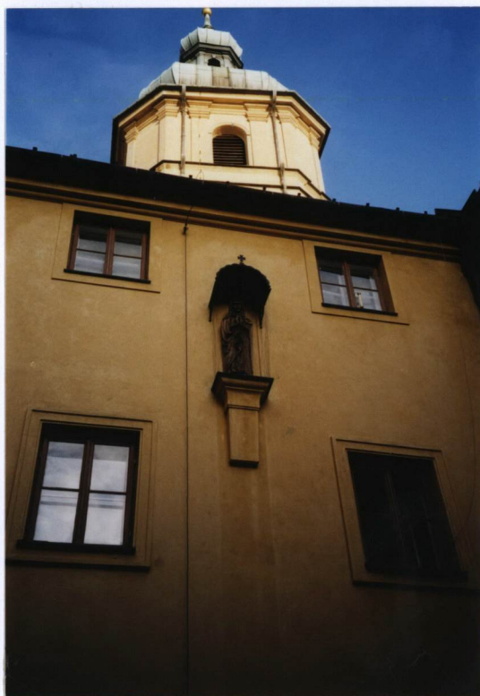
FOT. NR 7

6. Zawartość wkładki (nazwa materiału uzupełniającego) fotografie