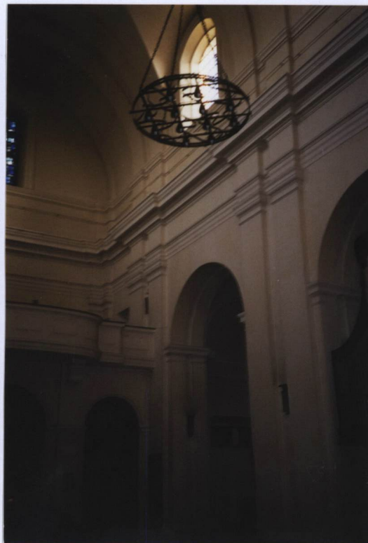
FOT. NR 11