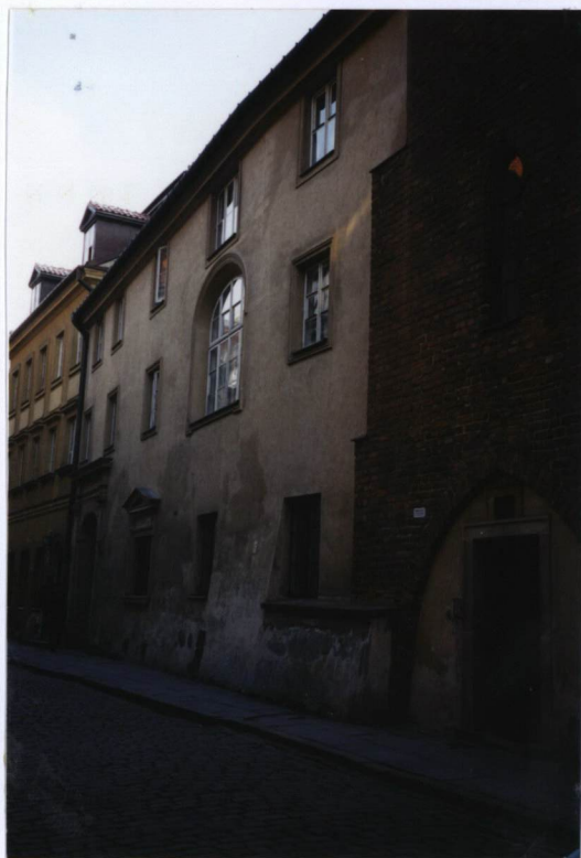
FOT. NR 3