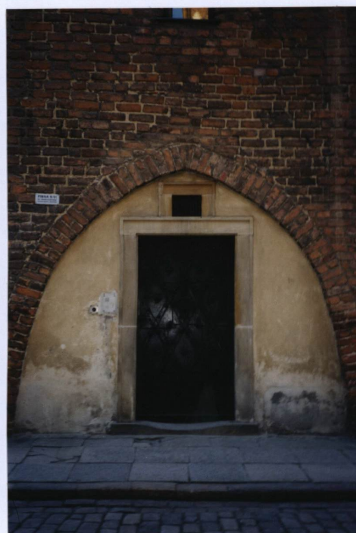
4 FOT. NR 5