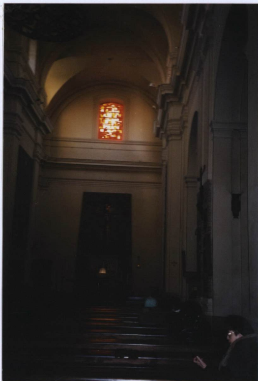
FOT. NR 10