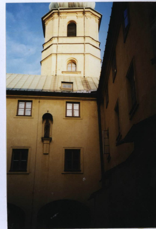
5 FOT. NR 6