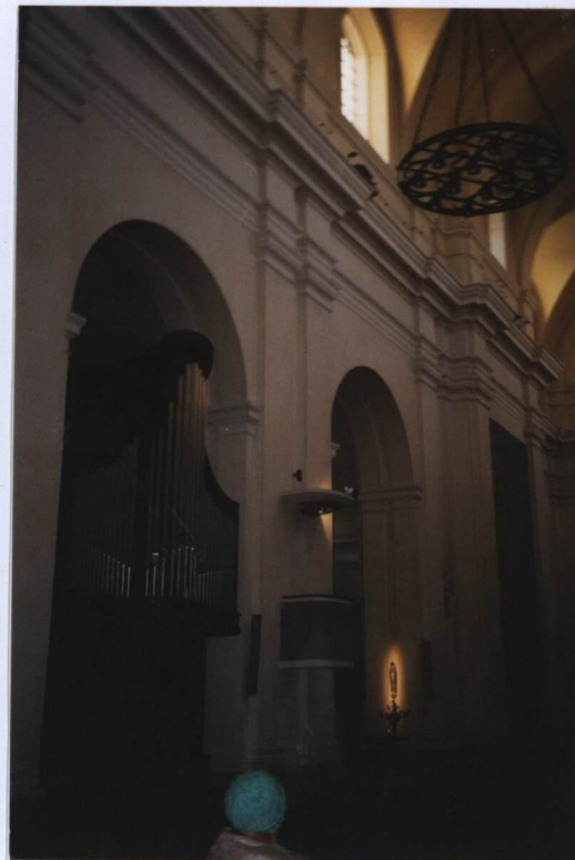
FOT. NR 12