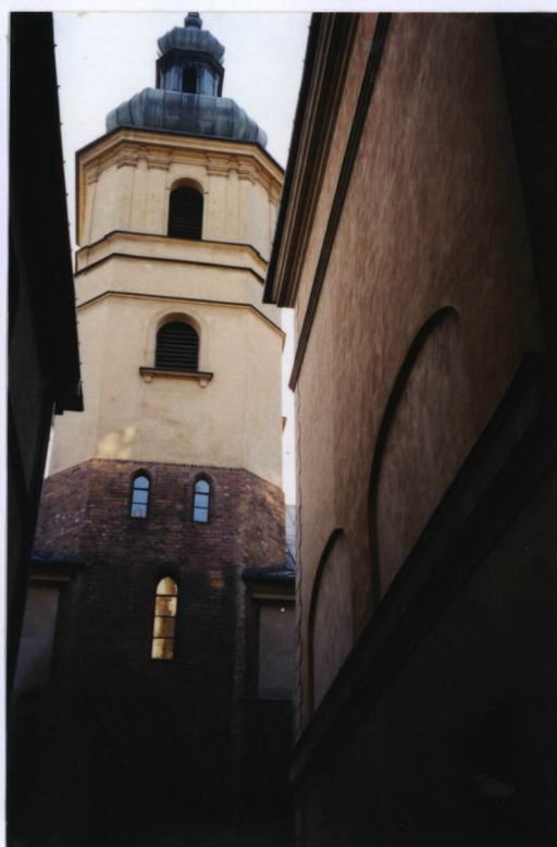
3 FOT. NR 4