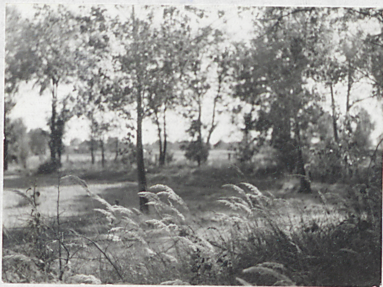
WSRÓD DRZEW SKĄBO DOSTRZEGALNE ZARYSY MOCIK