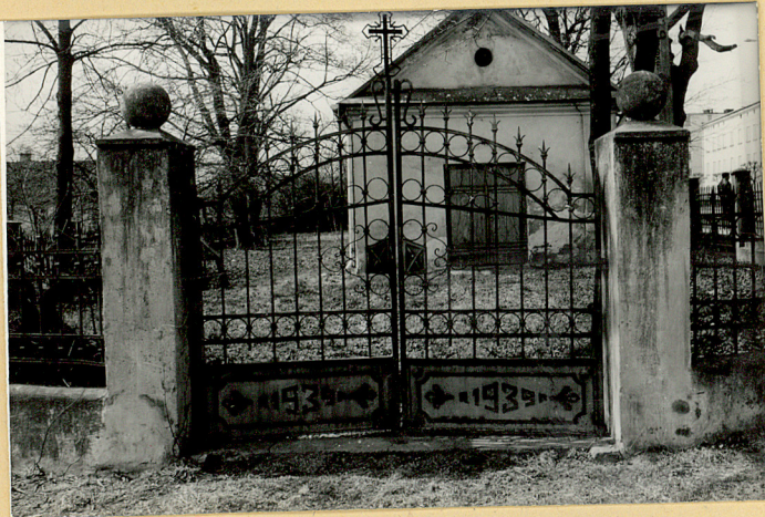
FOT.3 BRAMA WEJŚCIOWA NA CMENTARZ