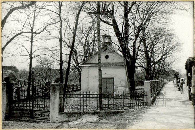
FOT.2 WIDOK OGÓLNY NA CMENTARZ Z ULICY, OD STRONY WSCHODNIEJ