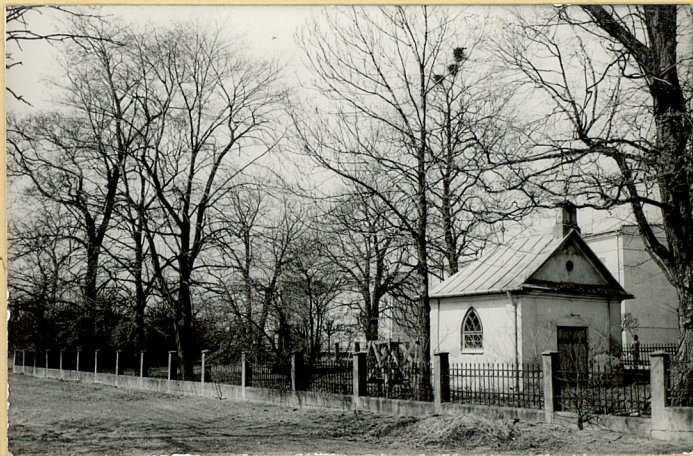
FOT.4 WIDOK NA CMENTARZ OD STRONY POŁUDNIOWEJ