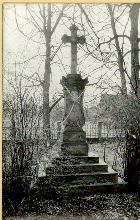
FOT.6 KRZYŻ PIASKOWCO- WY - 1894 R.