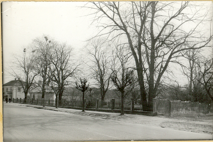
FOT.1 WIDOK OGÓLNY NA CMENTARZ Z ULICY, OD STRONY ZACHODNIEJ