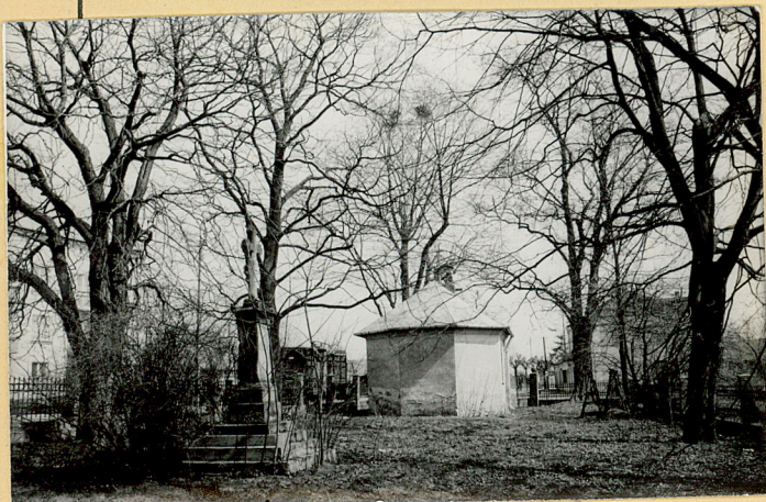
FOT.5 ZACHODNIA CZĘŚĆ CMENTARZA