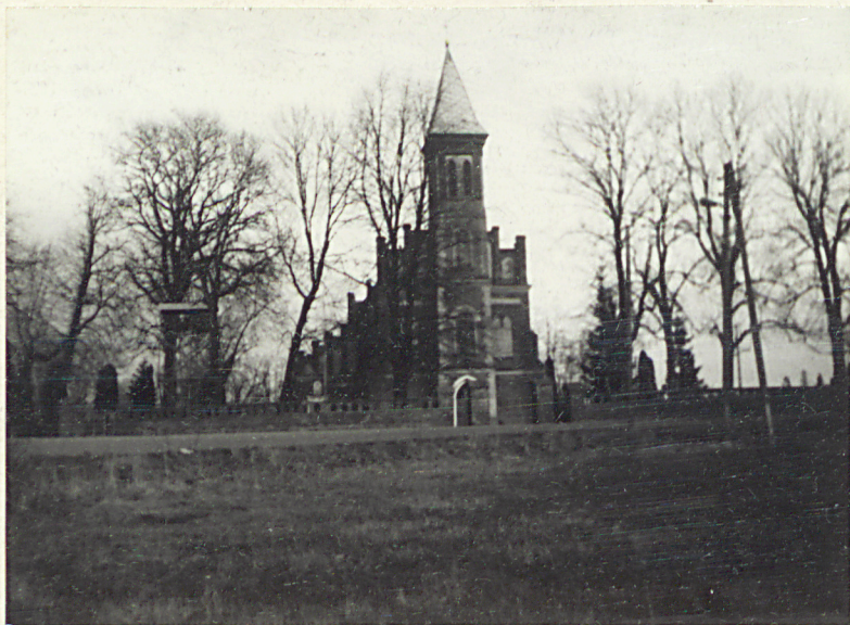
1. Widok od zach. na zotózenie kościelne