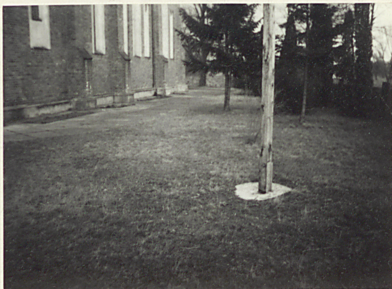
3. Cmentarz przykościelny od pñd