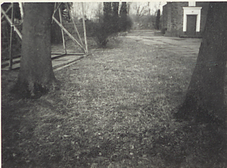
2. Cmentarz przykościelny od pñ