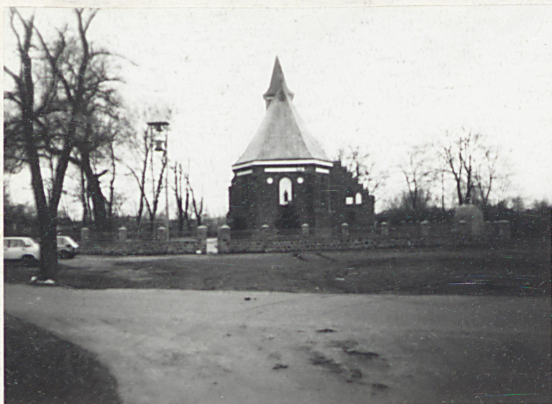
1. Zatrzymanie kościoła od wsch