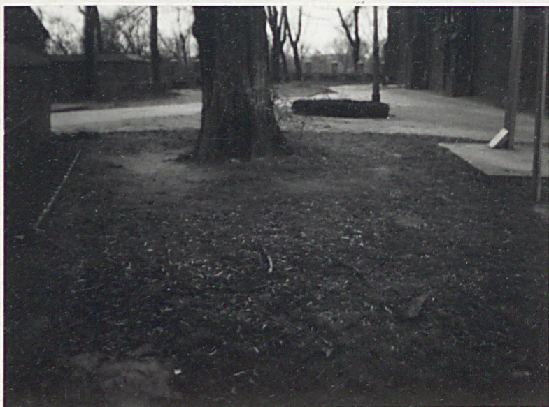
3. Cmentarz przykościelny od półd