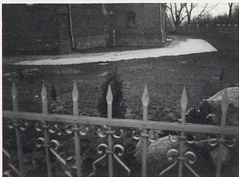
2. Cmentarz przykościelny od półn