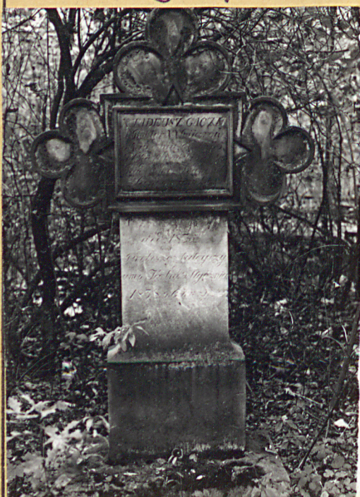
5. Grób X. Tadeusza Gadkiego / + 1838.