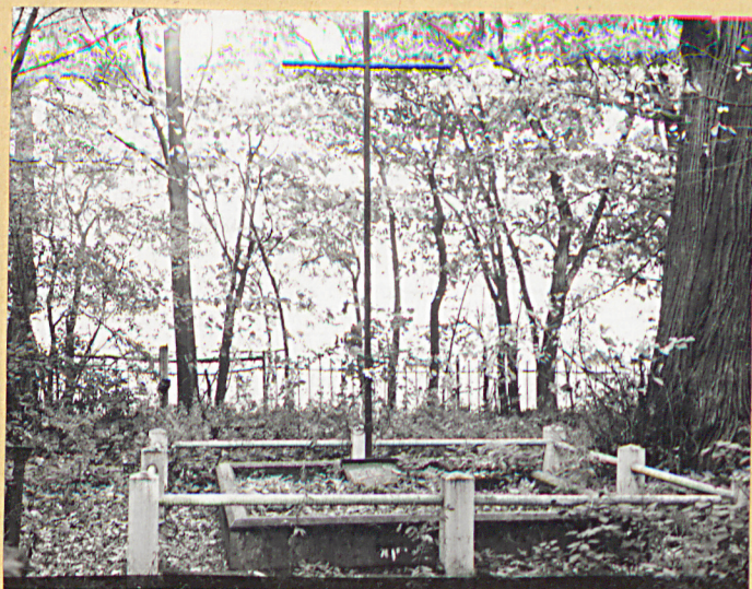
4. Mogiła powstańców z 1863 r.