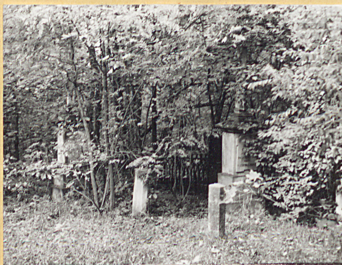
6. Widok ogólny w kierunku zachodnim.