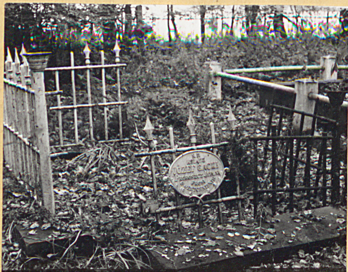
3. Grób X. Józefa Gadkiego.