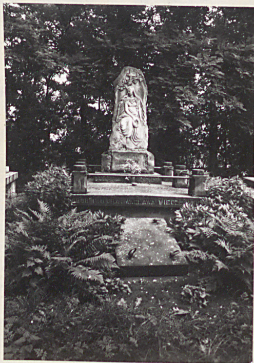
10. Grób rodziny Wierczowskich.