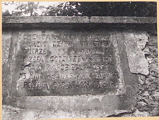
1. Płyta wmurowana w mur cmentarny.