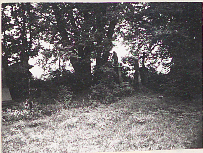
11. Widok ogólny w kierunku północno-wschodnim.