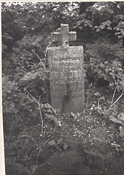
12. Mogiła żołnierzy poległych we IX, 1939 r. w kierunku północno-wschodnim.