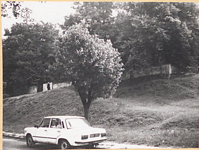
2. Mur zachodni. Wjście na cmentarz.