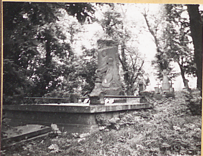
5. Grób rodziny Gódbiowskich.