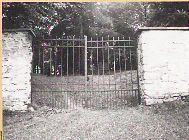
3. Brama cmentarna w murze zachodnim.