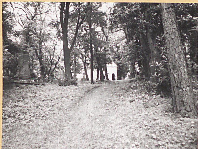
4. Aleja wschód-zachód. Widok w kierunku wschodnim. W głębi Kościół M.B. Śnieżnej.