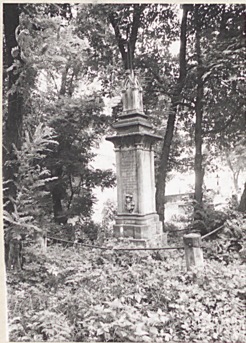
9. Grób Franciszka Babuńskiego (+1859).