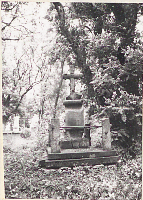
7. Grób Władysława Mrozowskiego (+1893).