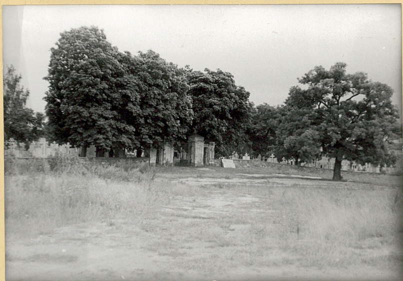
widok od pTd - zach.