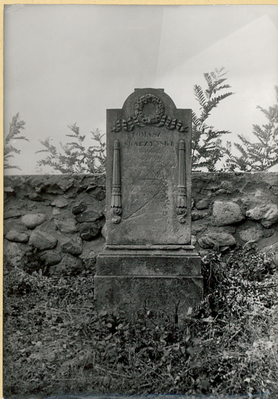
nagrobek Tomasza Skarżyńskiego