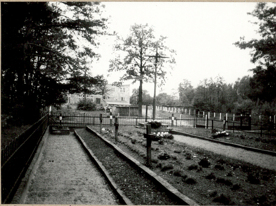
2. Teren cmentarza