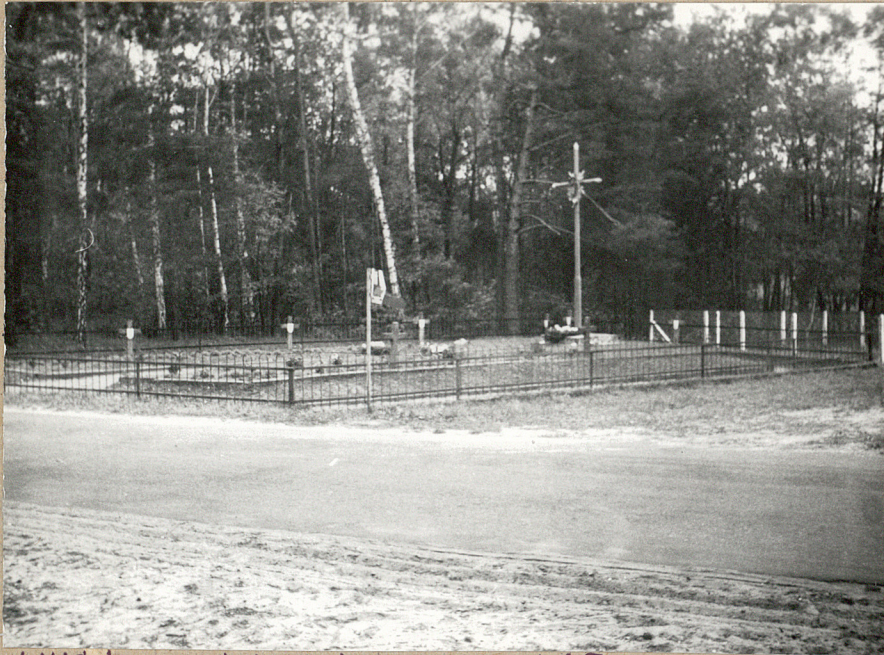
1. Widok cmentarza od strony drogi (półn)