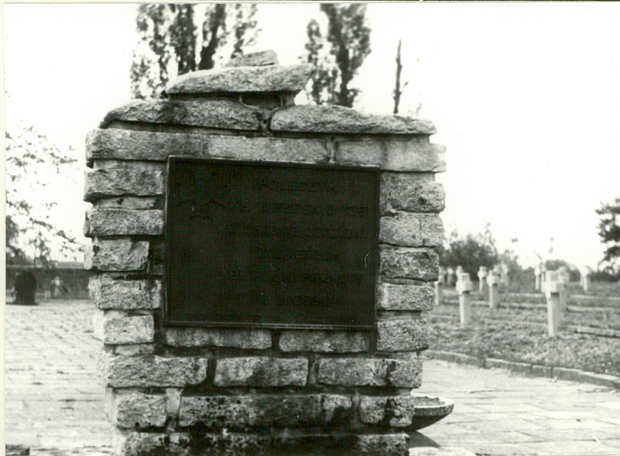
5. Pomnik środulny