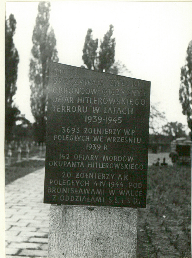
6. Tablica tuż za bramą

Wkładkę założył: E. Bonusiali x 1992 (imię, nazwisko, data)