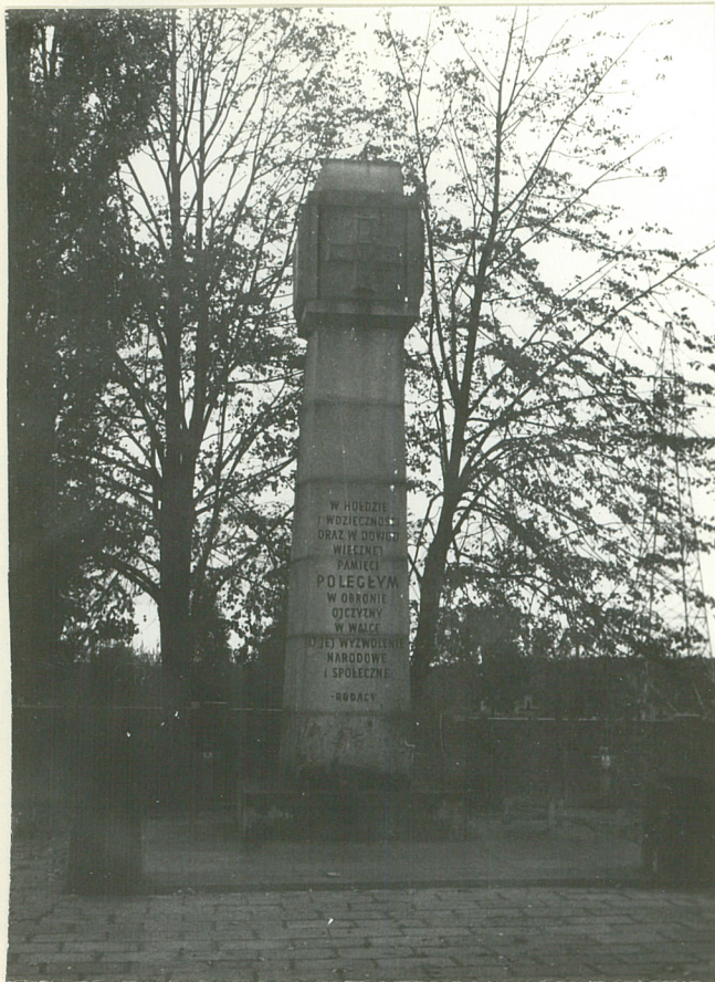
4. Pomnik m. gębki cmentarna

3. Zawartość wkładki (nazwa obiektu lub materiału uzupełniającego)