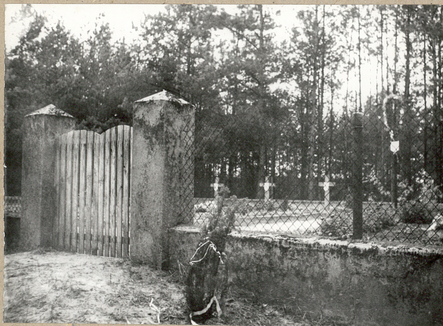
2. Widok od przodu