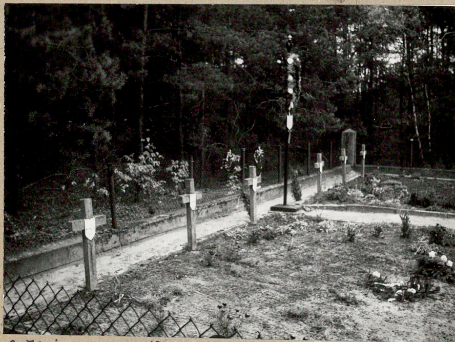
3. Zbiornik mogił