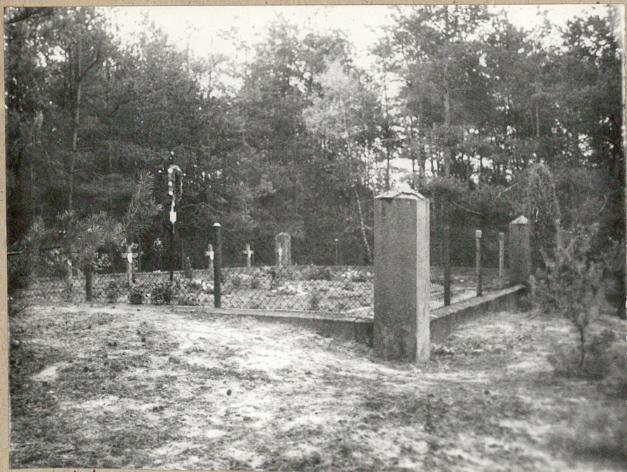
1. Widok od zewnątrz