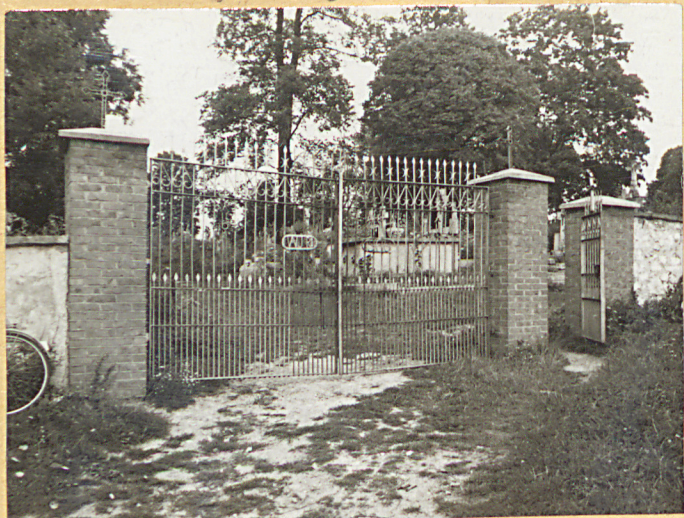
FOT. 1 BRAMA WEJŚCIOWA