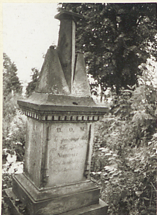
FOT. 13 NAGROBEK K. NIEMI- RYCZ, II P. XIX W.