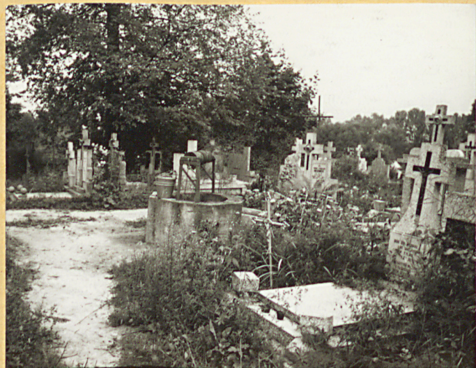
FOT. 6 FRAGMENT CMENTARZA . W CEN- TRUM STUDNIA