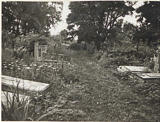
FOT. 8 ALENKA W PŁN. CZĘŚCI CMENTA- RZA - WIDOK OD WSCHODU