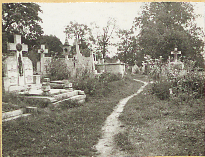
FOT. 3 ALEJKA BOCZNA Z PRAWEJ STRONY OD WEJŚCIA