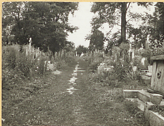
FOT. 4 ALEJKA NA WPROST BRAMY WEJŚCIOWEJ