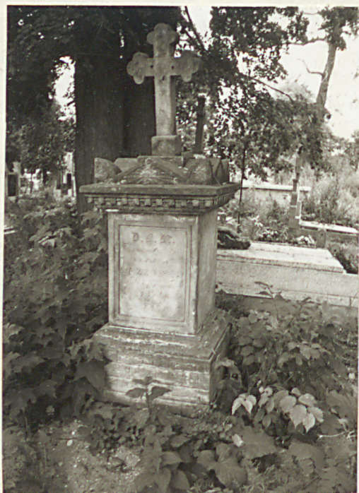
FOT. 11 NAGROBEK KLASYCYS- TYCZNY, II P. XIX W.