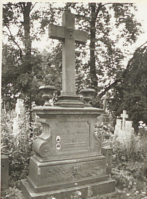
FOT. 12 NAGROBEK RODZINY CZERWONKA, I POK. XX W.