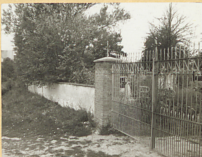
FOT. 2 BRAMA I FRAGMENT MURU CMENTARNEGO