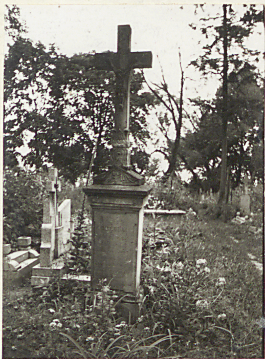
FOT. 9 NAGROBEK RODZINY MAG- DZIAK, II P. XIX W.