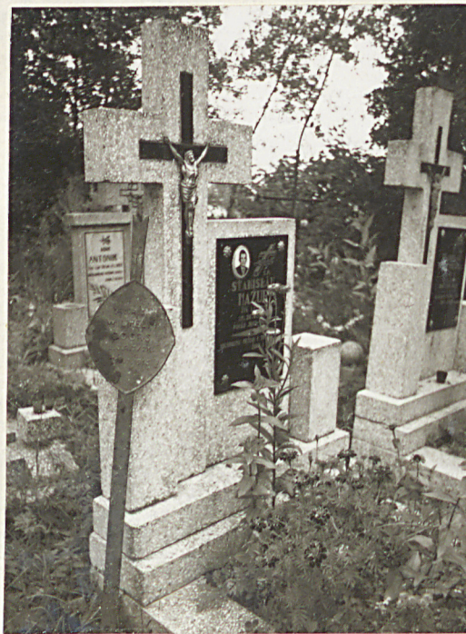
FOT. 10 KRZYŻ ŻELIWNY Z GRO- BU W. COORS'A, ZGINĄŁ 1915 R.