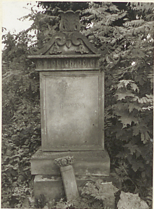
FOT. 15 NAGROBEK RUDZKIEGO, II P. XIX W.