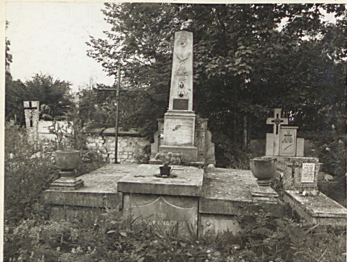
FOT. 7 GROB JANA GRUSZKI I BRONI GRUSZKÓWNY, II POK. XX W.