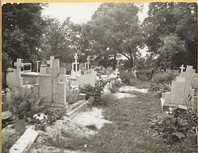
FOT. 5 FRAGMENT WSCHODNIEJ CZĘŚCI CMENTARZA