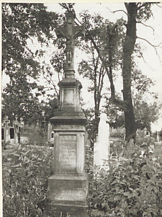
FOT. 14 NAGROBEK STANISŁAWA SINKIEWICZA, II POT. XIX W.