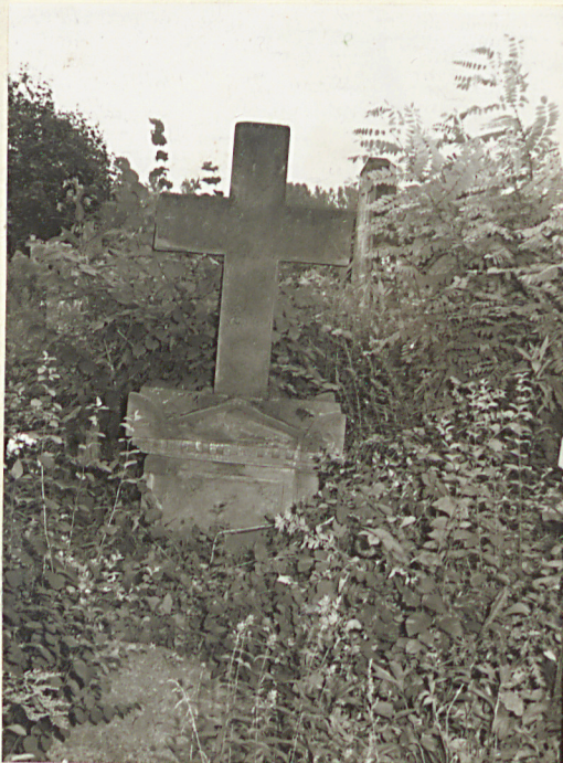
FOT. 16 NAGROBEK N.N., I POT. XIX W. (?)