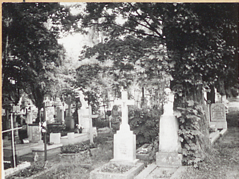
FOT.3 - WIDOK OGÓLNY KWATERY DZIECI