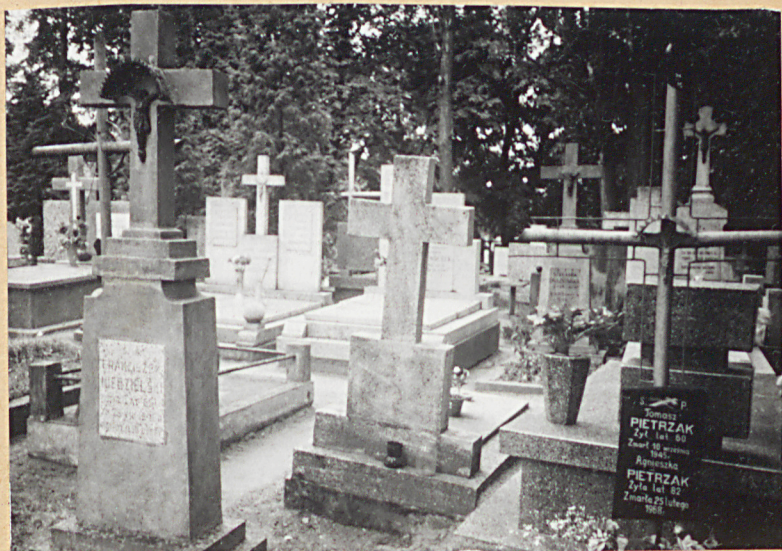
FOT.2 - OGÓLNY WIDOK NAJSTARSZEJ CZĘŚCI CMENTARZA