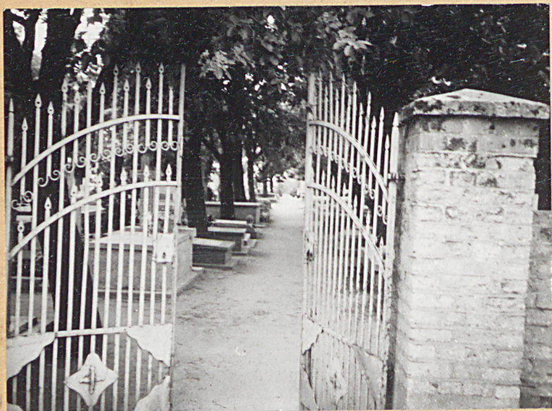
FOT.1 - BRAMA CMENTARNA