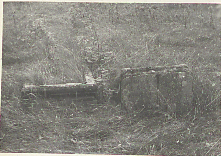
Fot. 8 Pozostałości cementowych obramowań i płyty nagrobnej