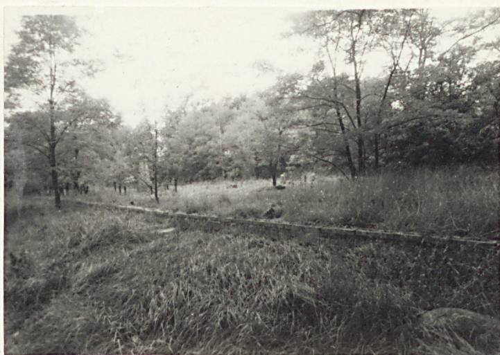
Fot. 2 Pozostałości muru ogrodzeniowego i widok ogólny na cmentarz