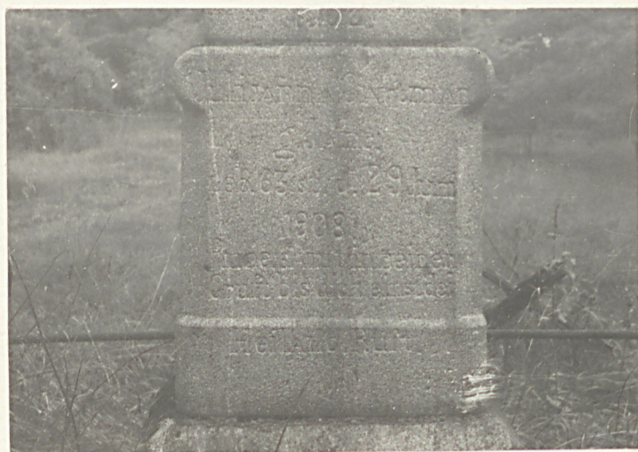
Fot. 4 Juliany Gastmann zm. w 1908 r. (cz. dolna)