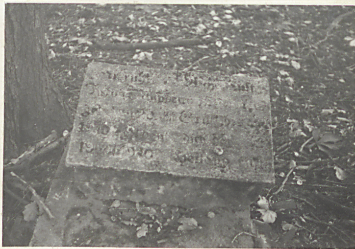
Fot. 7 Płyta nagrobna Wilhelmine Schröder zm. w 1926 r.