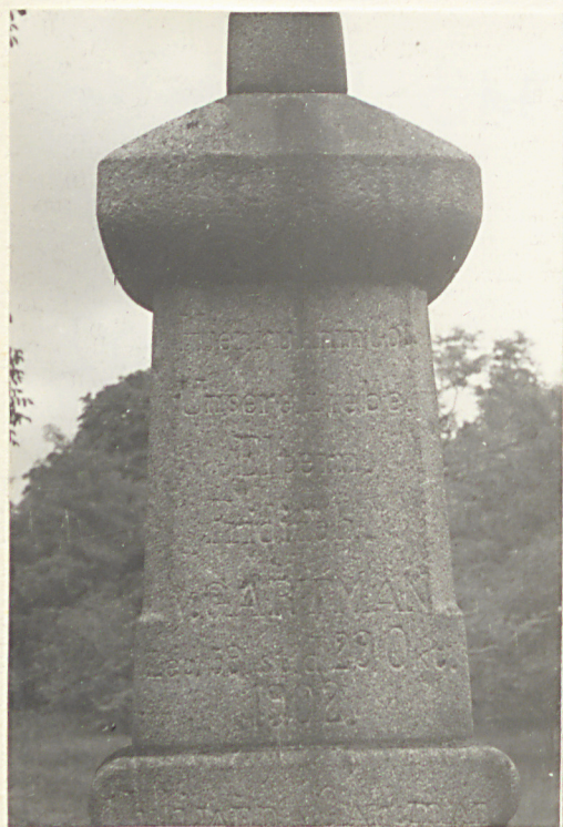
Fot. 3 Nagrobek Friedricha Gastmanna zm. w 1902 r. (cz. gorna)