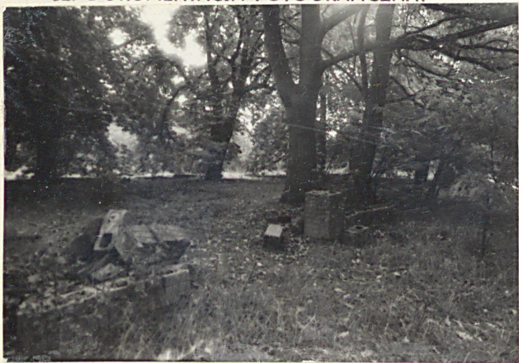
Fot. 1 Pozostałości bramy cmentarnej