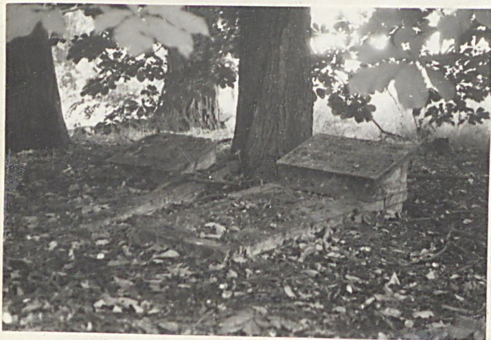
Fot. 6 Groby: z lewej - Jakub Schröder zm. w 1910 r.; z prawej - Wilhelmine Schröder zm. w 1926 r.