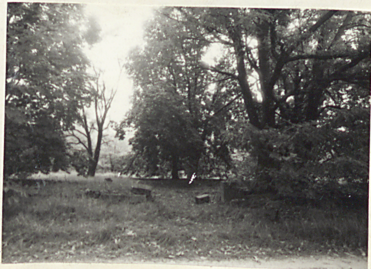
Fot. 9 Widok na centralną część cmentarza