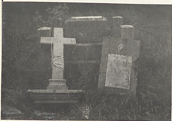
Fot. 5 Fragmenty nagrobka Matilde Kliver zm. w 1931 r. (w. w 1831 r.)