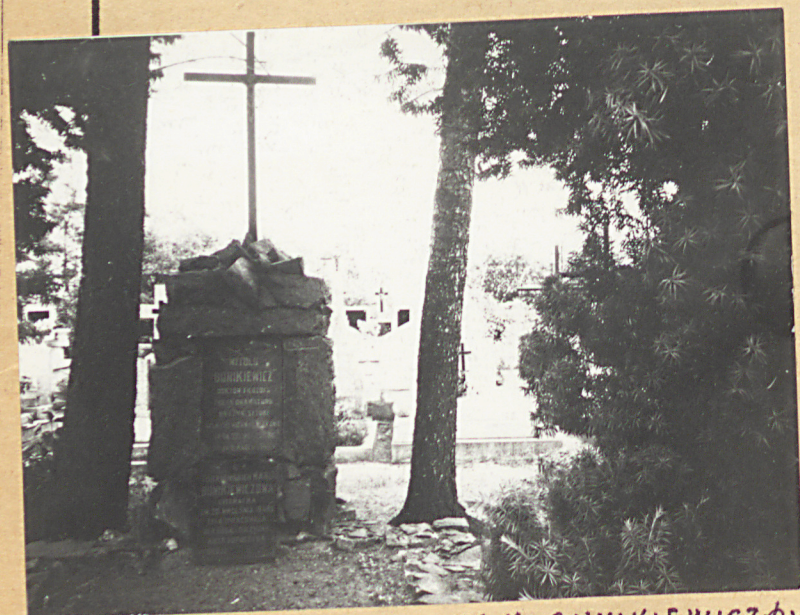
FOT.5 - NAGROBEK W. M. BUNIKIEWICZÓW (PATRZ poz. 5 w punkcie 15)