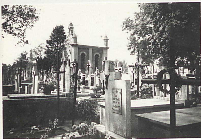
FOT. 10- OGÓLNY WIDOK STARSZEJ CZĘŚCI CMENTARZA