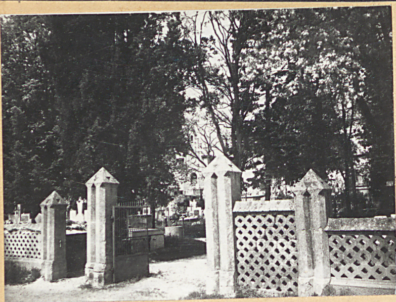
FOT.1 - BRAMA CMENTARNA