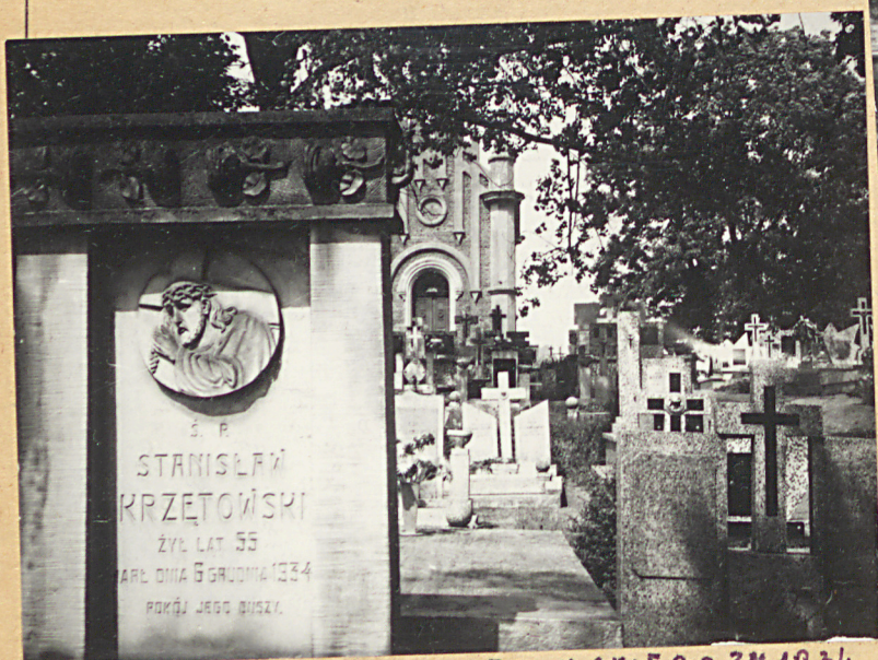
FOT.3 - NAGROBEK ST. KRZĘTOWSKIEGO ZM. 1934 NA 7LI