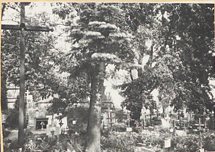
FOT.2 - KRZYŻ CMENTARNY