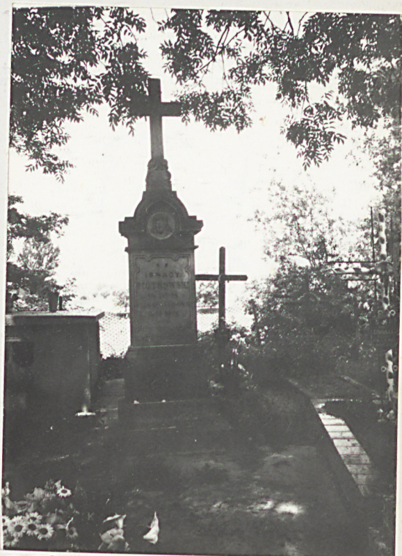
FOT. 9- NAGROBEK PIOTROWSKIEGO