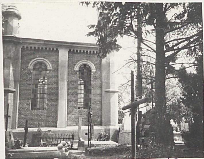
FOT. 6- FRAGMENT CMENTARZA PRZED ZACHODNIA, ELEWACJA KAPLICY