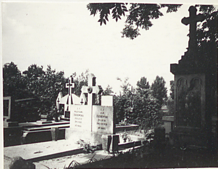
FOT. 11- FRAGMENT WSCHODNIEJ CZĘŚCI CMENTARZA