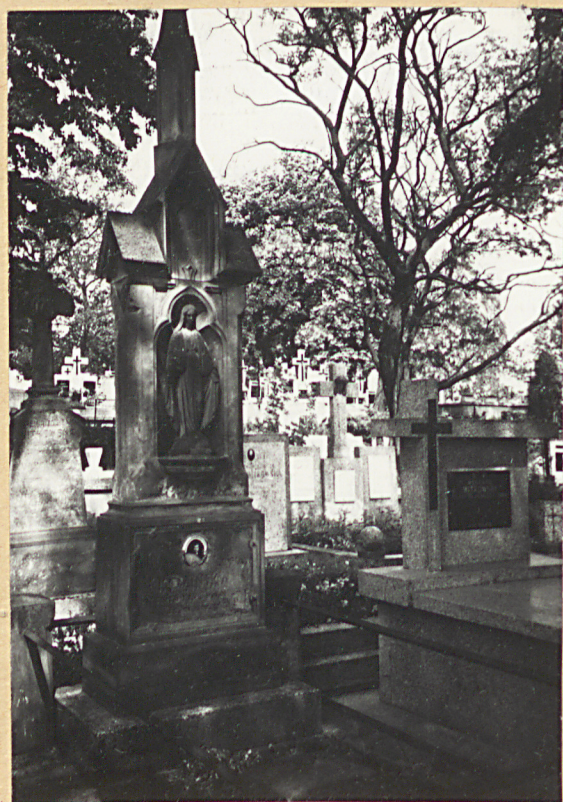
FOT.4 - NAGROBEK POPIELARSKIEJ ZM. 1939R.