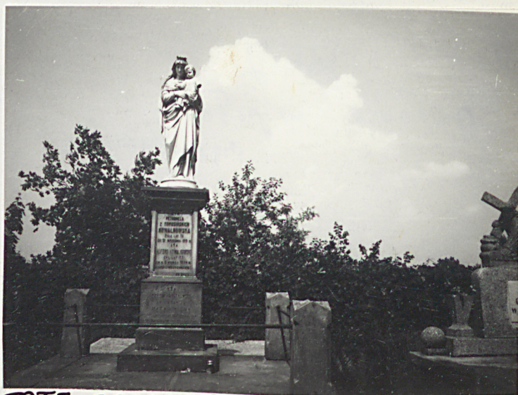
FOT. 7- GROBOWCE W POŁNOCNEJ CZĘŚCI (NAJSTARSZEJ) CMENTARZA