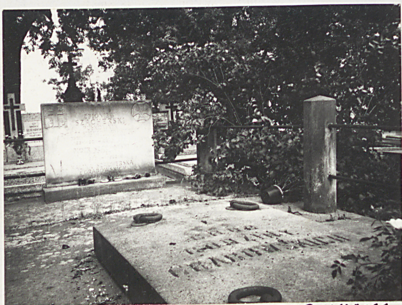
FOT. 8- PŁYTA NA GROBIE RODZINNYM GRABOWSKICH