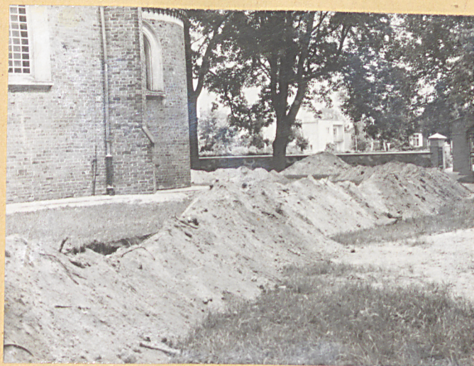
② Rozkopany teren wokół kościoła, podczas prac osuszających kościół.