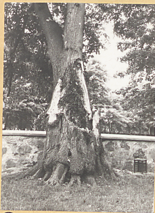
⑤ Lipa z słamanym korawem.