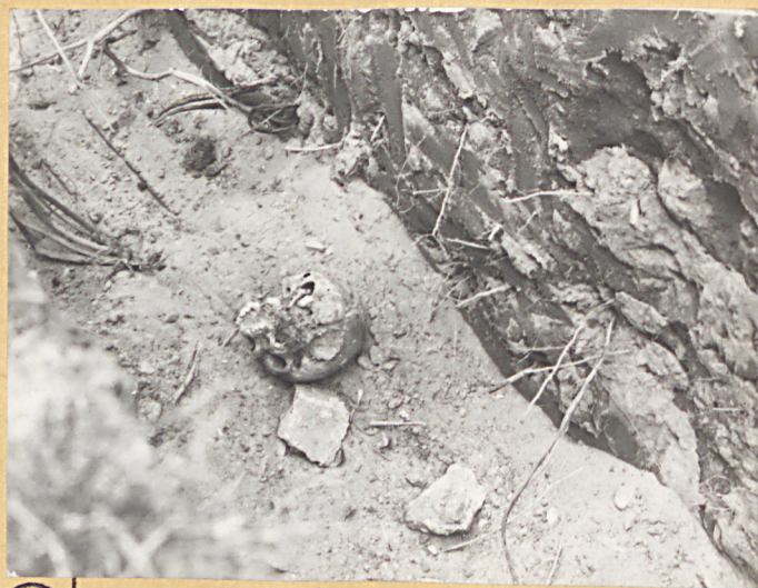
③ Czaszka w wykopie.