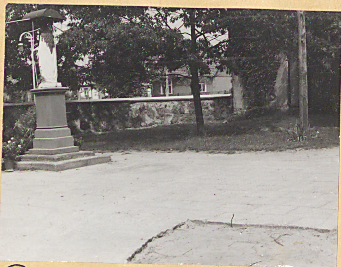
① Teren przed wejściem do kościoła.