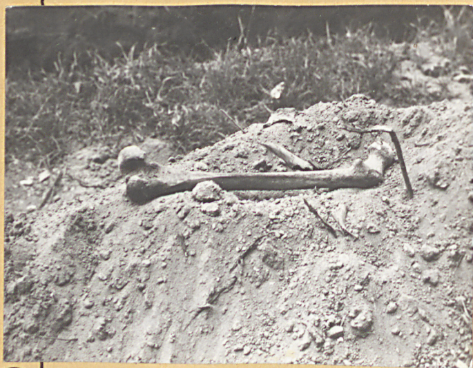
④ Wykopany piszczał.