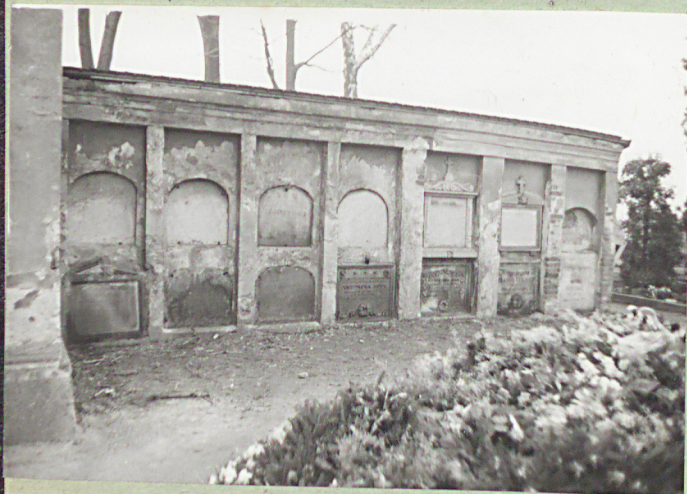
5. Katakumby. Strona lewa.