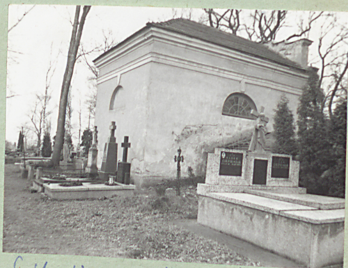
6. Kaplica cmentarna. Nawierzchnia potu- dularo-wschodni.