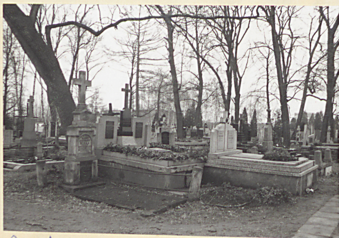
7. Widok ogólny w Kiewie południowo-zachodnim.