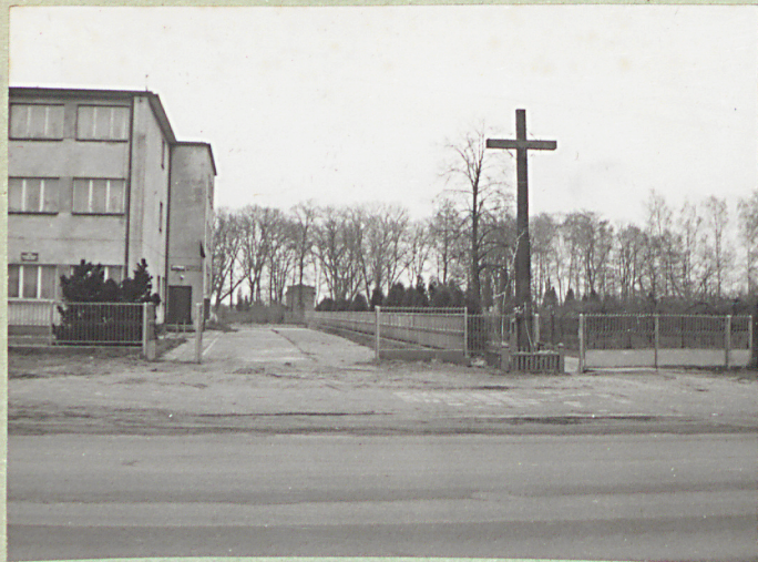
1. Widok ogólny od drogi Grójec - Bława Mazowiecka.