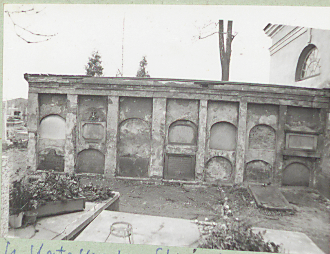
4. Katakumby. Strona lewa