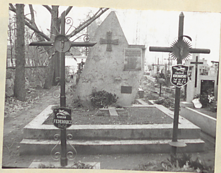
10. Grob zbiorowy żołnierzy 44 pp poległych we IX, 1939r.