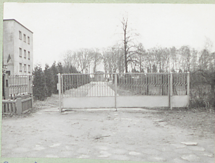
2. Wejście na cmentarz. W głębi Kaplica cmentarna.