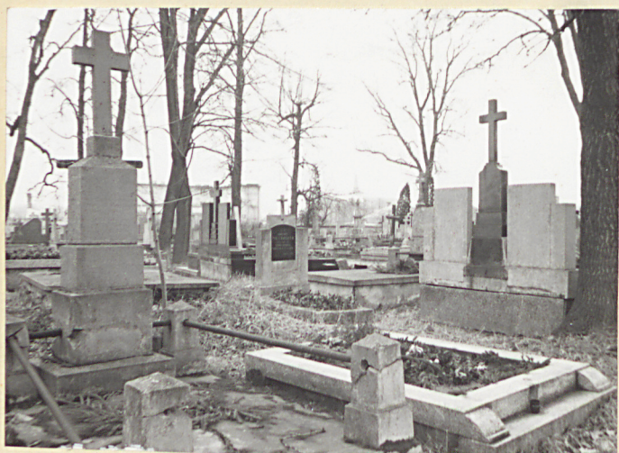
9. Widok ogólny w Kiewie południowo-zachodnim.