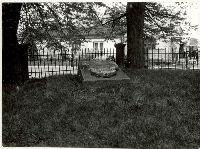
9. Płyta nagrobna z XIX w. z nieczytelną inskrypcją