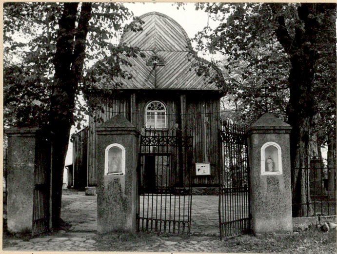
1. Wejście na cmentarz przykościelny i kościół p.w. św. Stanisława BPA z XVIII w.