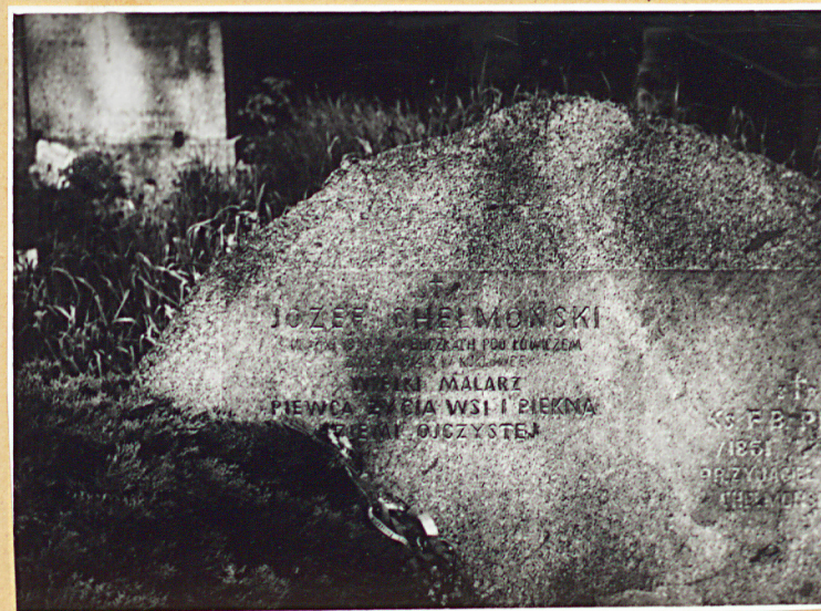
GROB JÓZEF CHEKMOŃSKIEGO