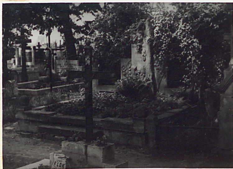
1930 r. GRÓB BARANIAKÓW 1929 r. GRÓB GZULÓW