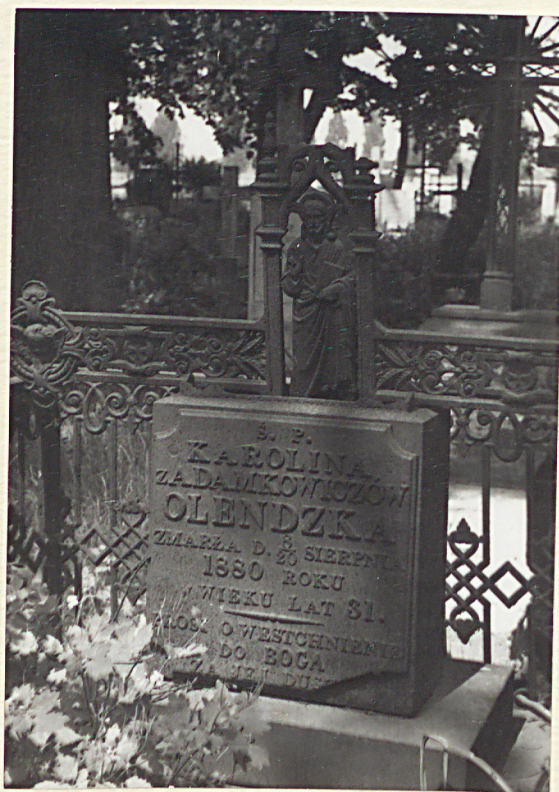
1880r. GROB OLENDZKIEJ