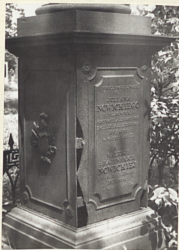
1867r. GROB PKŁ. NOWICKIEGO