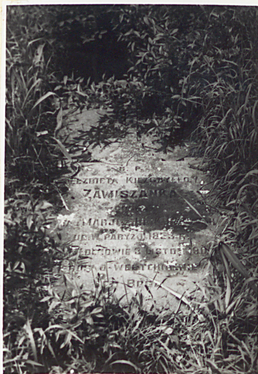
1902 r. GRÓB ZAWISZANKI