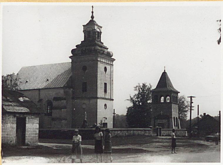
KOŚCIÓŁ XVI W