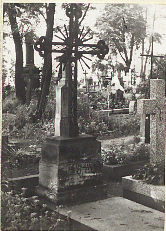
1870 r. GRÓB KSIAMIARY