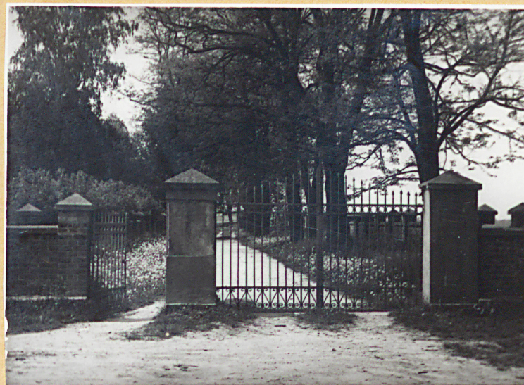
BRAMA Z TABLICĄ KU CZCI CHEKMOŃSKIEGO