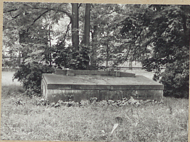
6. GROBOWIEC RODZINY PLEBAŃSKICH