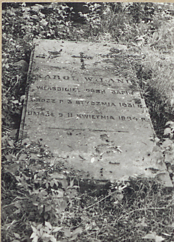
4. KAROL WILAND, 1884 WEASZCIEŁ DÓBR BASIN