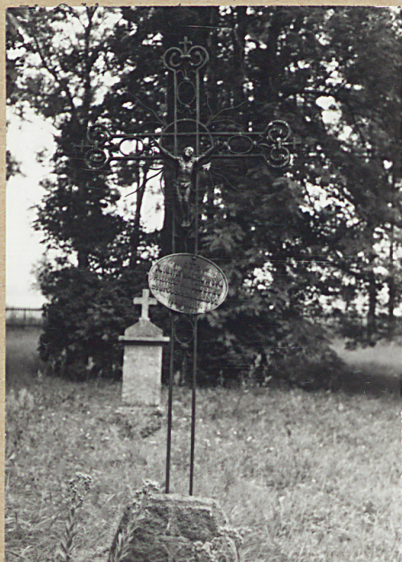
11. CZĘŚĆ ŚRODKOWA