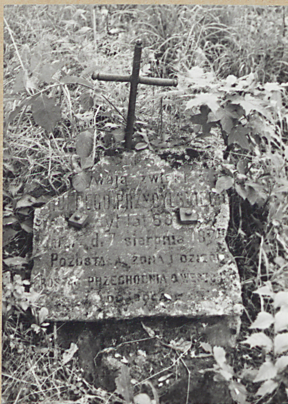
8. ONUFRY PRZYBYLSKI, 1874