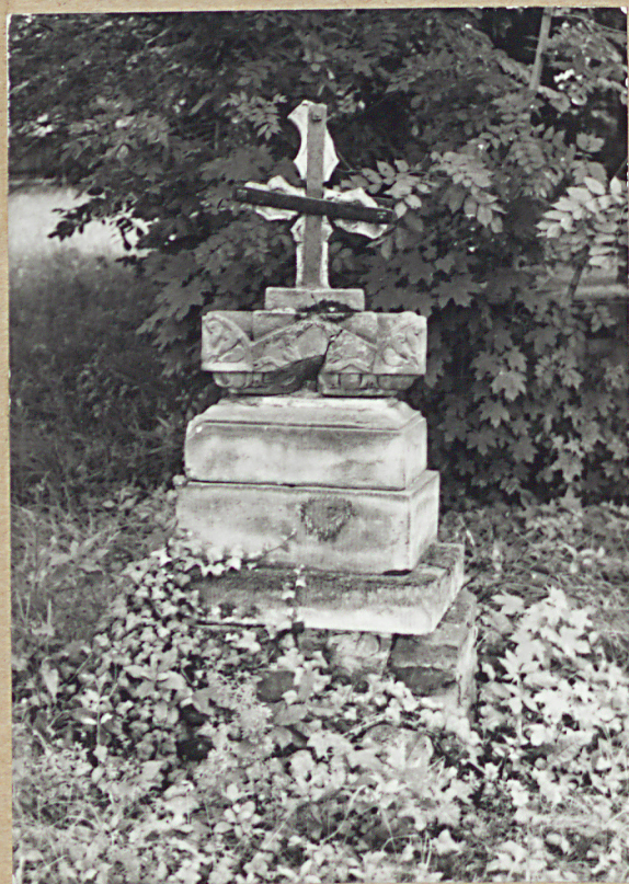
13. NN, 1839