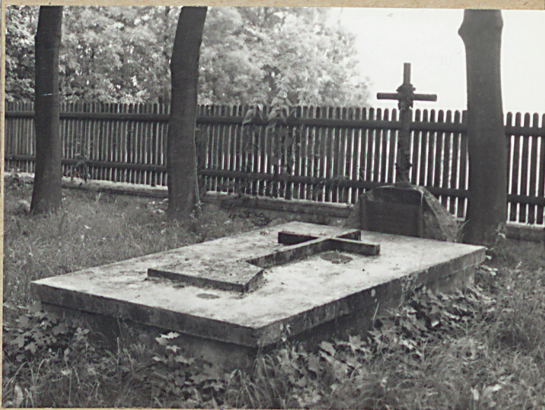
5. YZABELA SKÓRZEWSKA, 1883