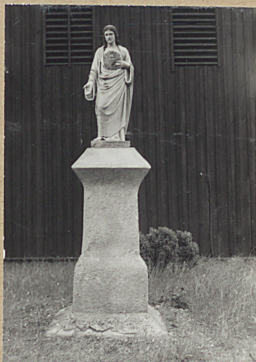
16. FIGURA PRZED DZWONNICĄ