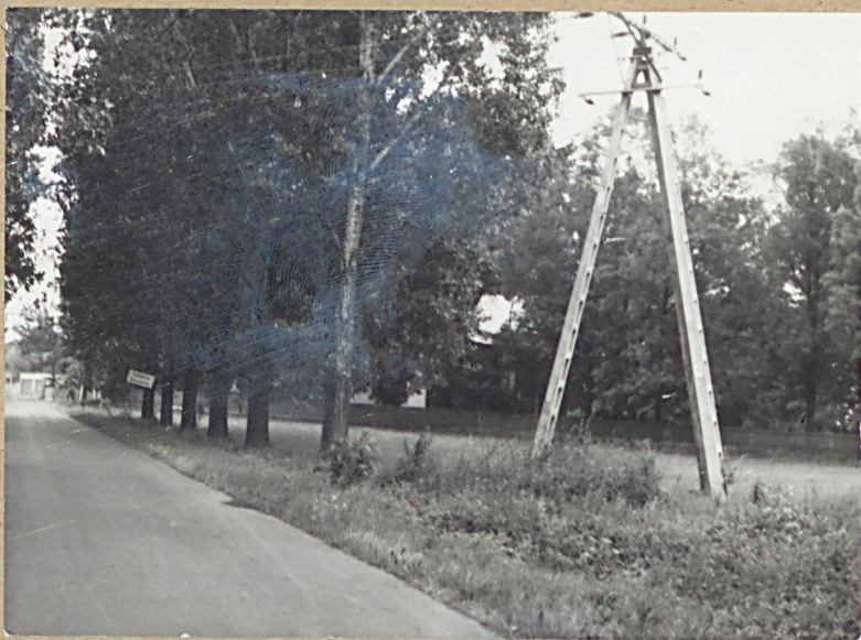
1. WIDOK OGÓLNY Z SZOSY