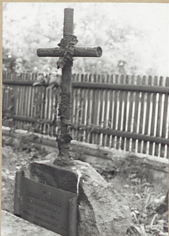
9. IZABELA SKÓRZEWSKA, FRAGM. 1883