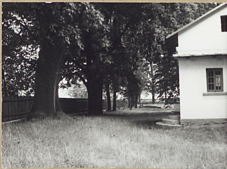
3. WIDOK STRONY PN-ZACH.