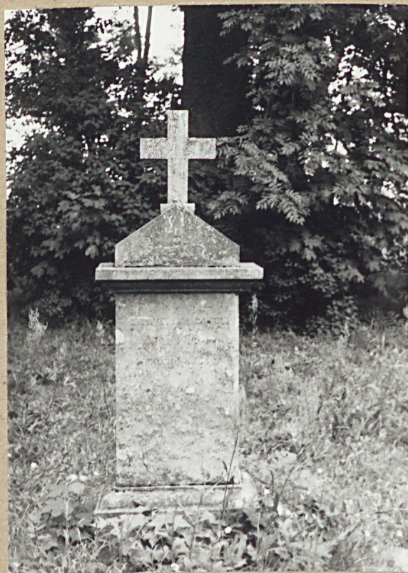
14. KS. MATEUSZ JTALSKI, 1847