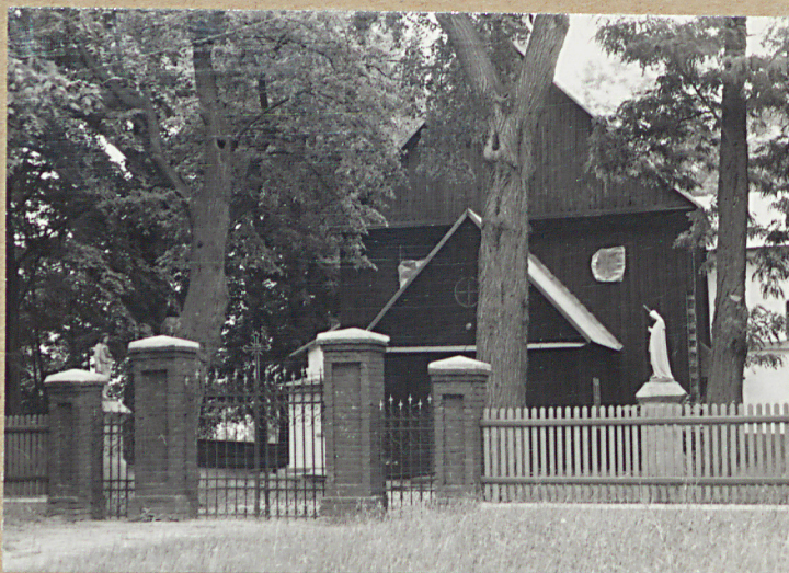
15. BRAMA WEJŚCIOWA