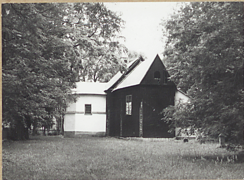
2. STRONA WSCHODNIA