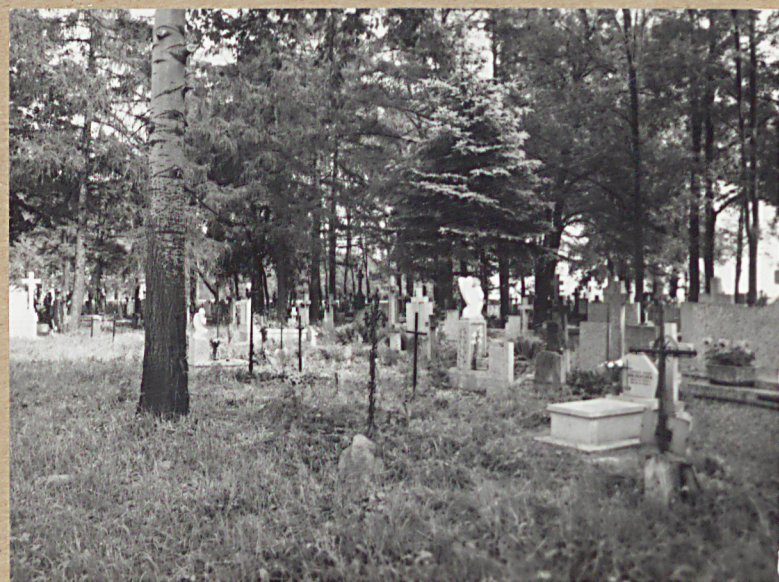
7. STRONA PD.