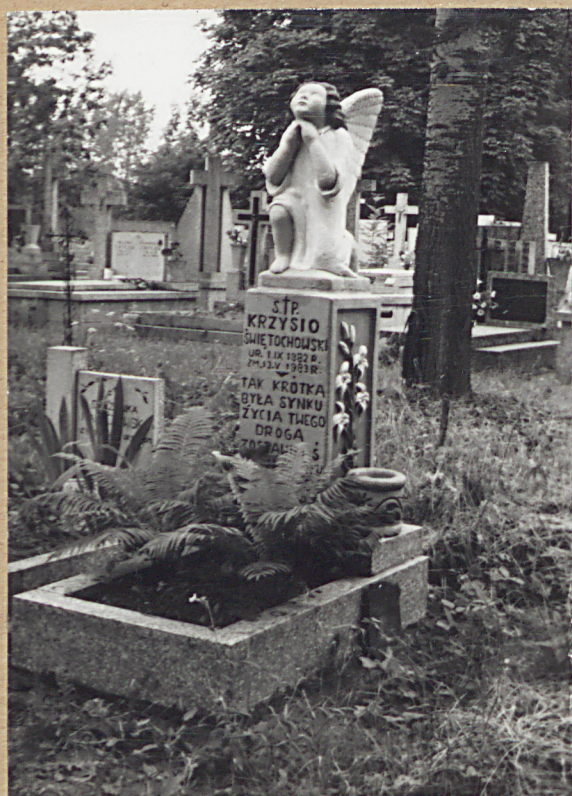
5. KRZYSZ ŚWIĘTOCHOWSKI, 1983