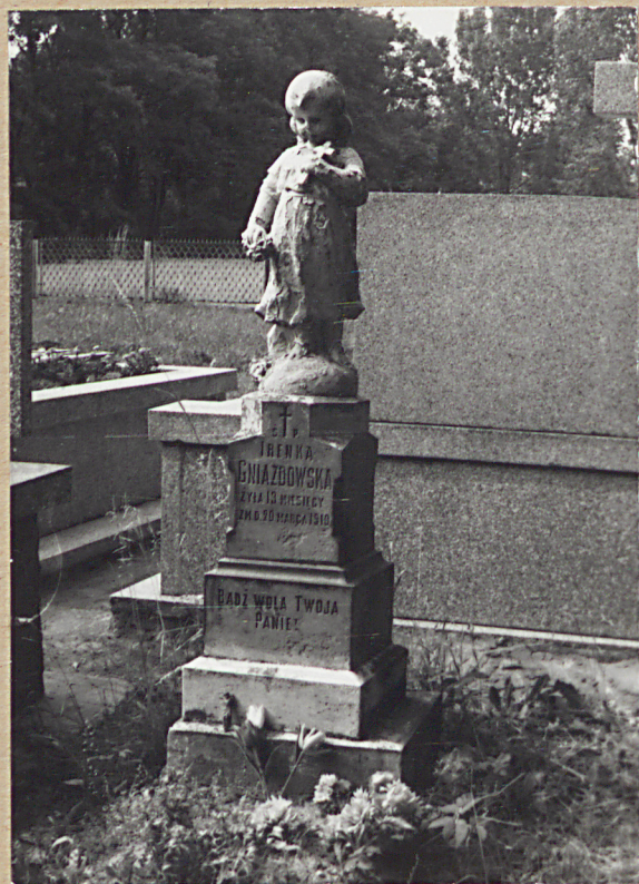
14. IRENKA GNIAZDOWSKA, 1906