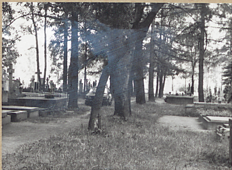
6. ALEJA PN.-PD.