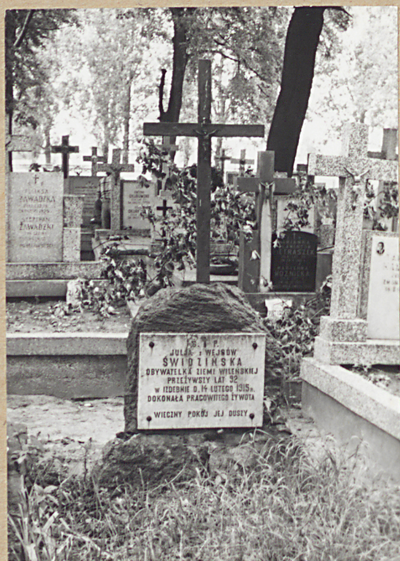
16. JULIA z WEJSÓW ŚWIDZIŃSKA, 1915