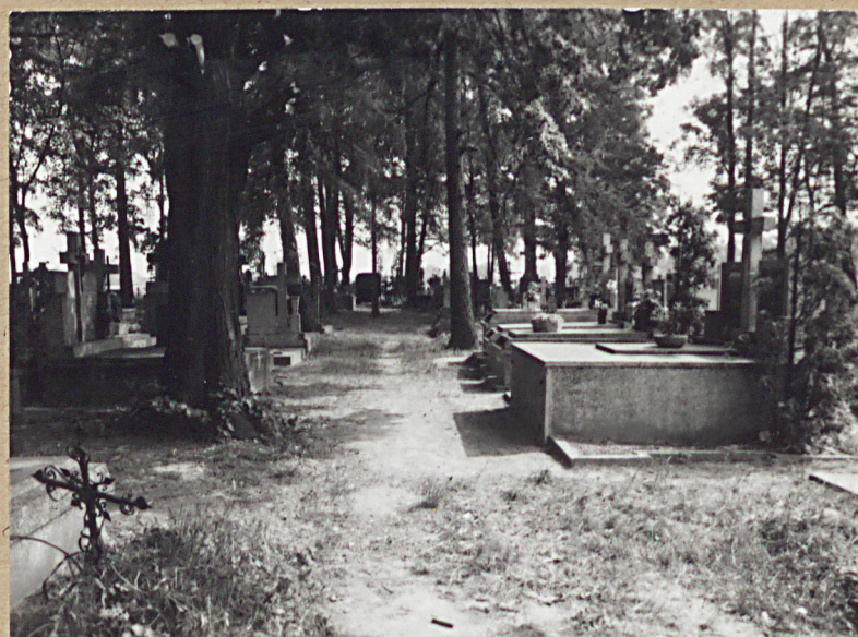
9. ALEJA WSK. - ZACH.