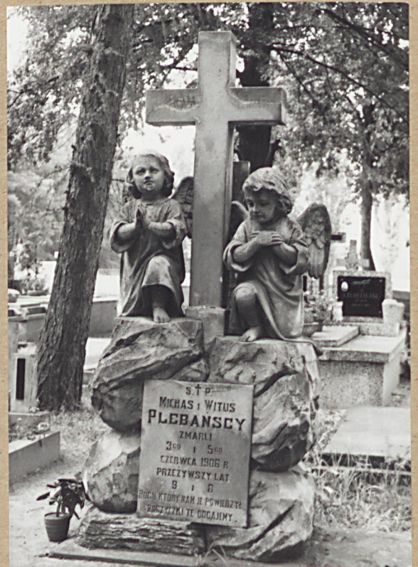
13. MICHAŁ i WITUS, 1906

11-13. GROBOWIEC RODZINY PLEBAŃSKICH, WKAŚCIELI IZDEBNA