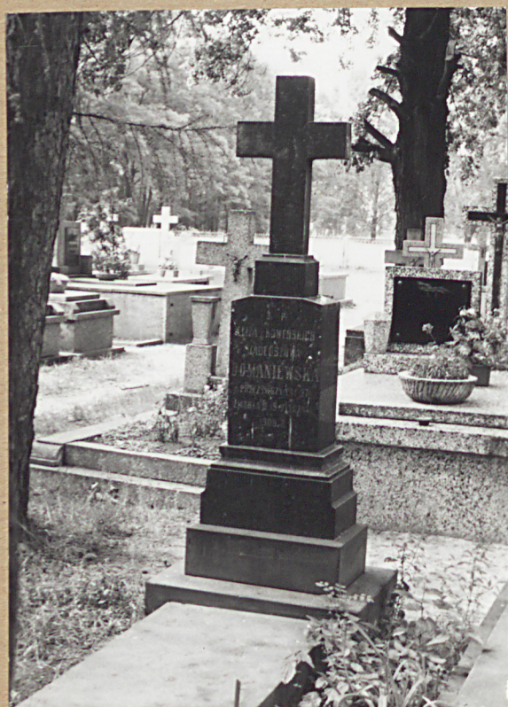
8. ELIZA Z KOWERSKICH DOMANIEWSKA, 1908