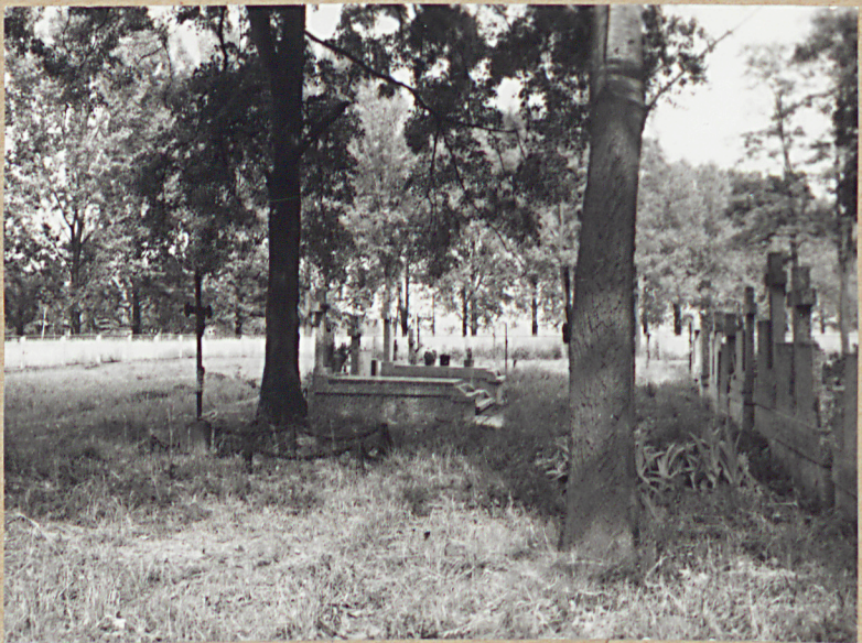
4. STRONA 9N.