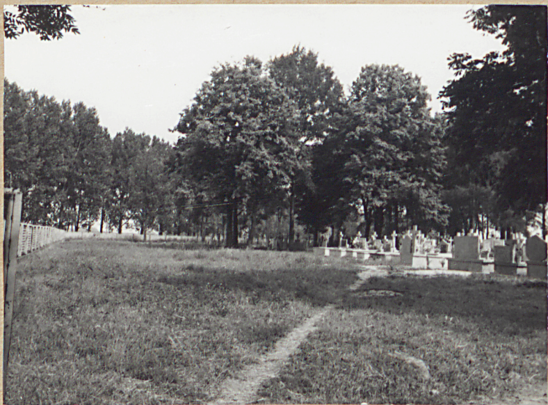
2. WIDOK OD BRAMY