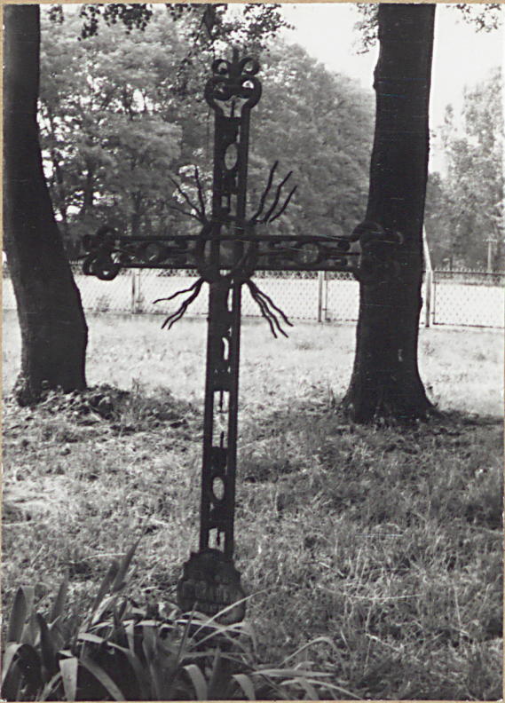
10. JAKÓB OFOZAREK, 1893