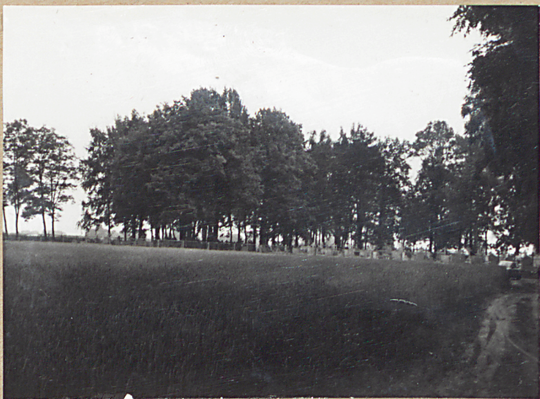
1. WIDOK OGÓLNY OD 9N. Z DROGI