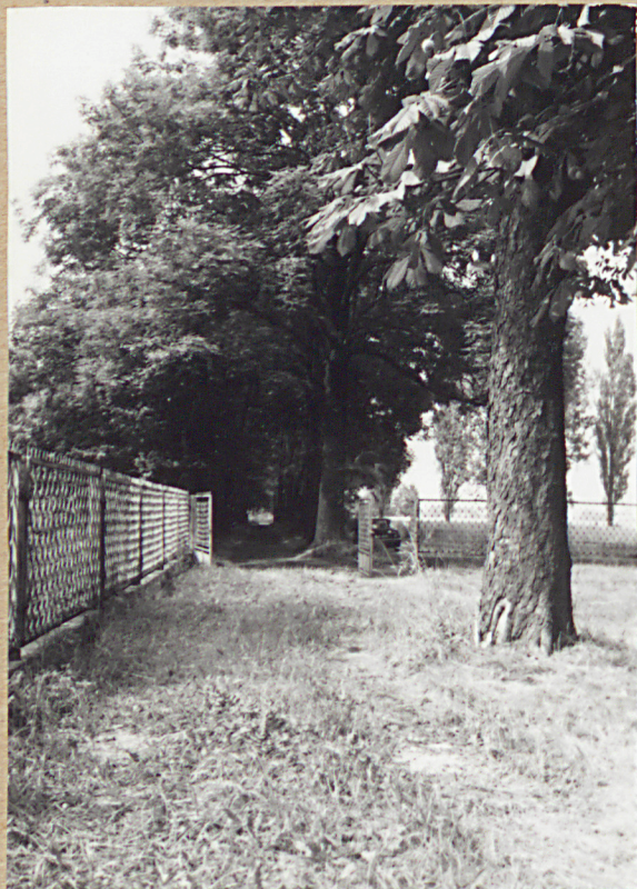
3. STRONA 9N. - WIDOK NA BRAMĘ I ALEJĘ DORTSCIOWĄ