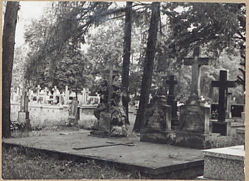
11. GROBOWIEC RODZINY PLEBAŃSKICH, WIDOK OGÓLNY