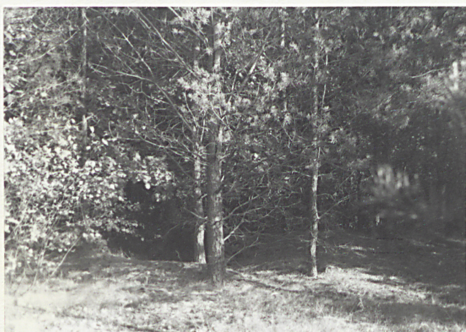
1. Widok z zachodu, rozkopane groby.