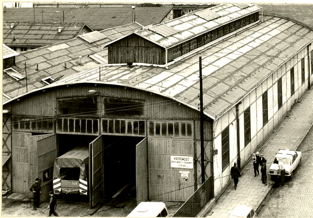
data wykonania 1984 r miejsce przechowywania negatywów