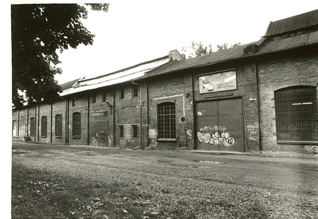
budynek produkcyjny /1/ widok od : płd-wsch.,płn-wsch