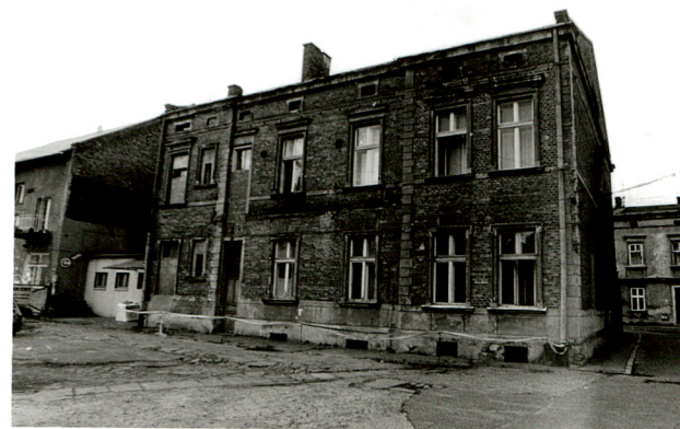
budynek administracyjny /3 / widok od : zachodu, płd-zach., od wschodu