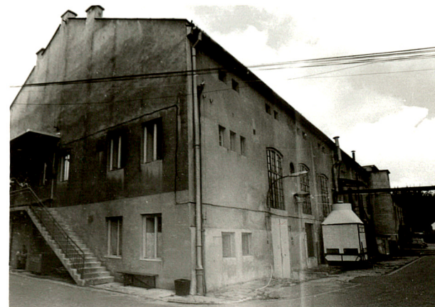
budynek produkcyjny /4 / widok od płd-wsch