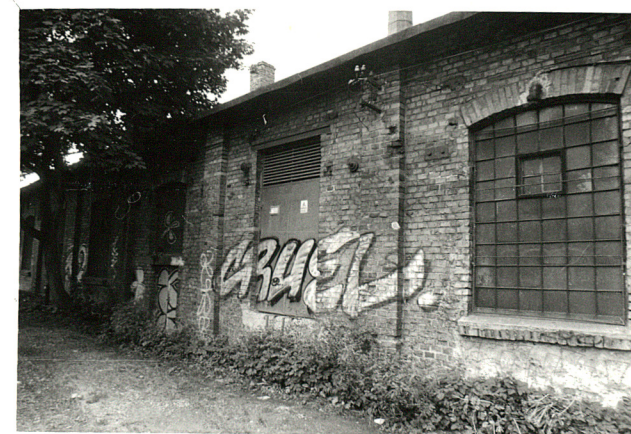
budynek produkcyjny /2/ widok od : północy /skrzydło /, widok od zachodu, widok od wschodu