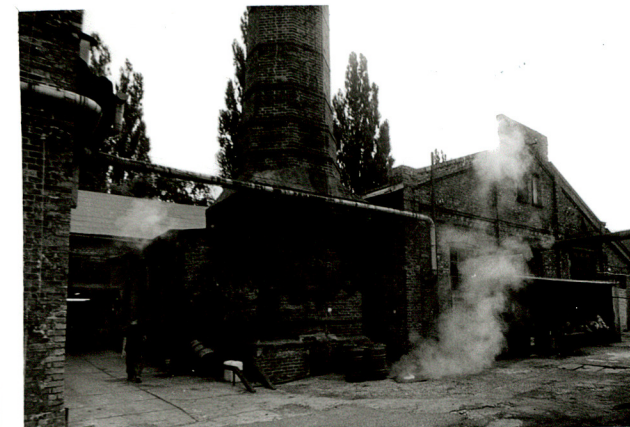
budynek produkcyjny /2 / skrzydło środkowe ? widok od płn-zach; płd-zach i od zach.