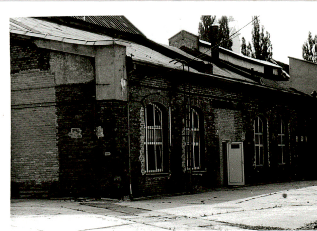
budynek produkcyjny /2 / skrzydło północne: widok od zach., płn. i płd.