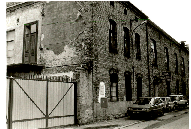
budynek mieszkalny /6/