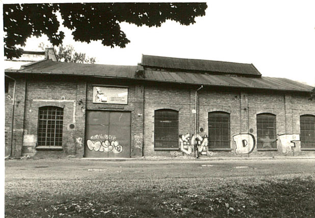
— budynek produkcyjny (1) widok od wschodu