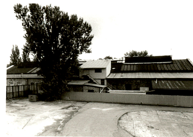
budynek produkcyjny /1/ widok od płn-wsch., od płn., od zach.

Wkładkę założył: mgr M.H. Grabski VII 2001 r.