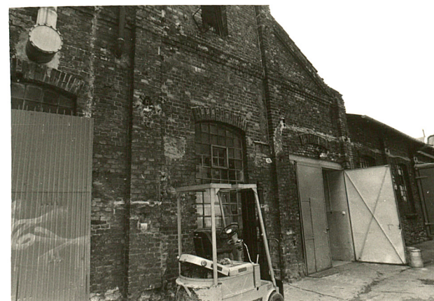
budynek produkcyjny (1) widok od południa