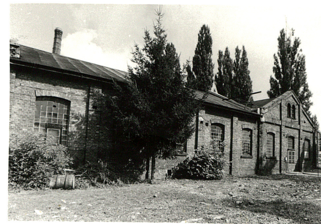
budynek produkcyjny /2 / widok od południa