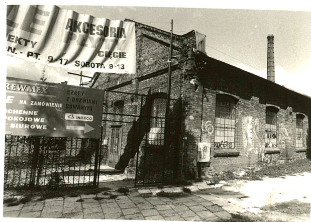
budynek produkcyjny (1) widok od półd-wsch.