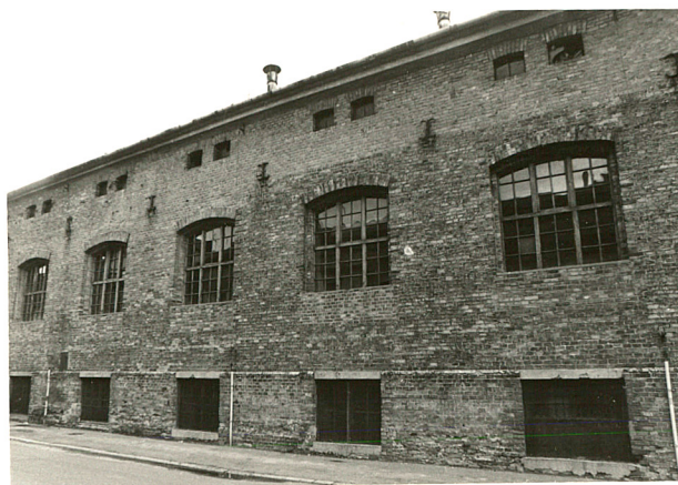
budynek produkcyjny /4 / widok od płd-zach., od i od zach.