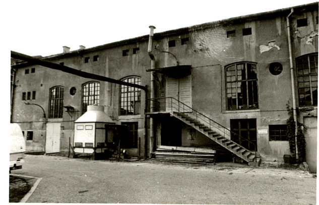
budynek produkcyjny /5 / widok od pł-zach., od płd-zach, od płn-wsch.