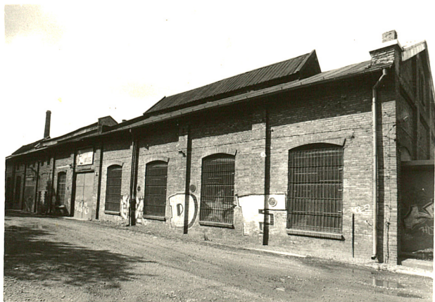
— budynek produkcyjny (1) widok od półn-wsch.

Ogrodzenie zespołu zachowane jest we fragmentach. Przy budynku administracyjnym (nr 3) zachowany jest odcinek ceglanego, pełnego muru z prostopadłościennymi słupami. W odcinkach muru profilowane, spłaszczone łuki. Słupki nakryte czterospadowymi daszkami. Pomiędzy budynkami produkcyjnymi (1 i 2) dawna brama wjazdowa z murowanymi ceglanymi słupami i dodatkowym wejściem przez furtkę w odcinku muru. W pozostałych granicach zespołu ogrodzenia nowsze, z różnych materiałów. W ostatnich latach część przybudówek przy obiektach, powstałych w różnych okresach eksploatacji, została rozebrana.