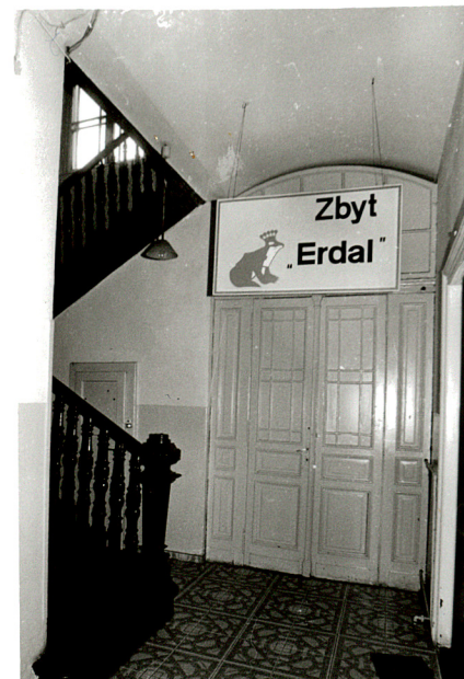
budynek administracyjny /3/ widok od półn-wsch., klatka schodowa, stolarka drzwiowa