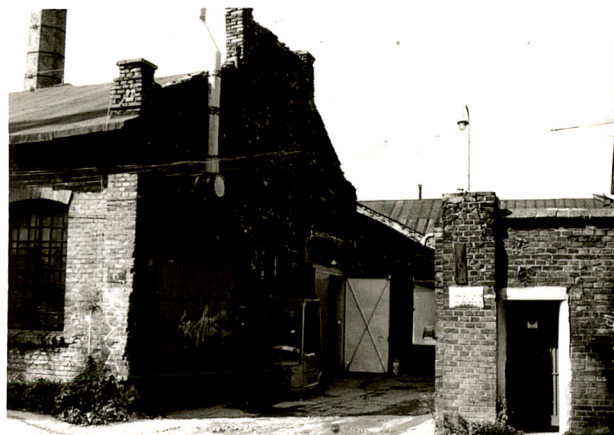
Dawna Fabryka Maszyn Rolniczych M. Peterseima - Kraków, ul. Helmana Żółkiewskiego 17