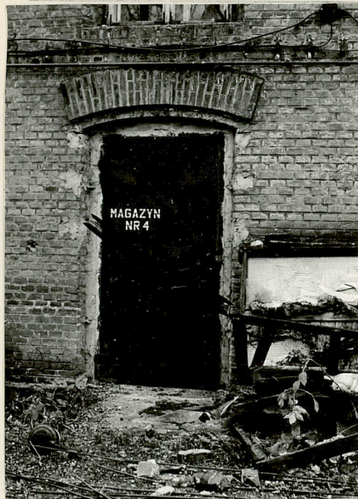
12 drzwi koszar