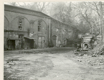
14 fragment elewacji