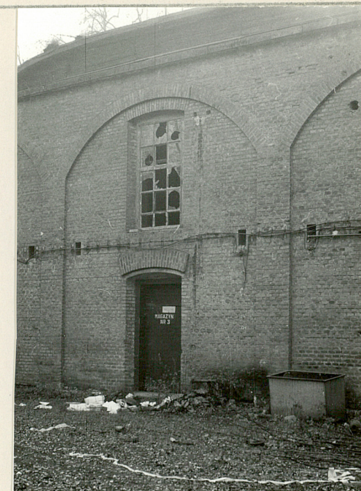
19 fragment elewacji