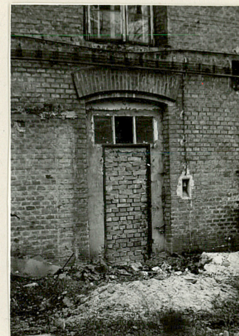
21 drzwi koszar