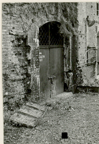
15 brama do głównej poterny