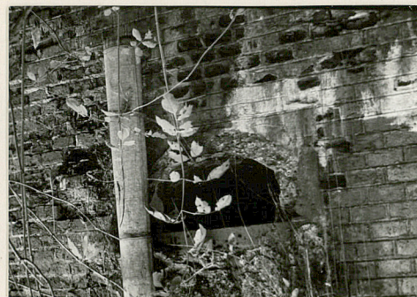
13 otwór okienny