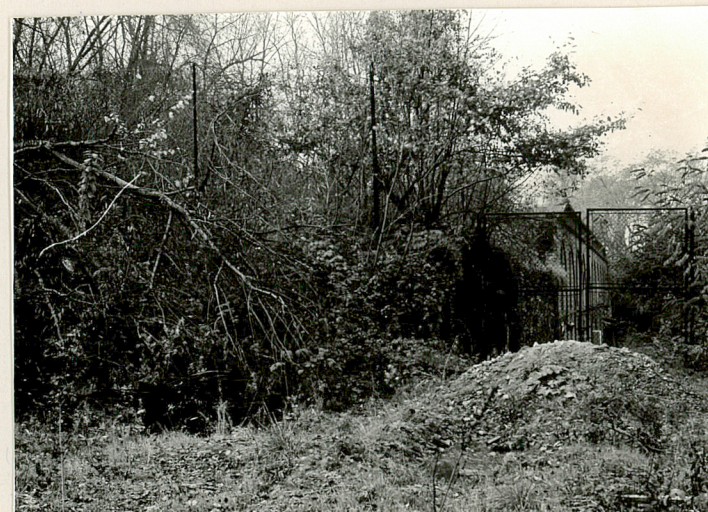
16 pochylnie na wał artyleryjski