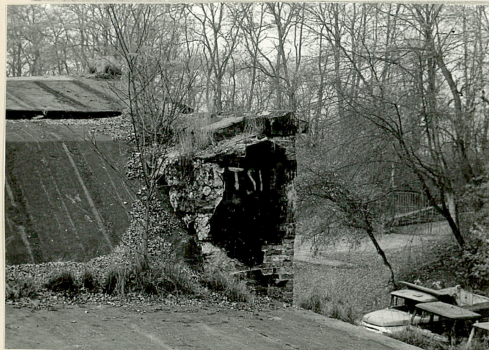
17 fragment stropodachu

3. Zawartość wkładki (nazwa obiektu lub materiału uzupełniającego) rzut, przekrój 1:500, zdjęcia