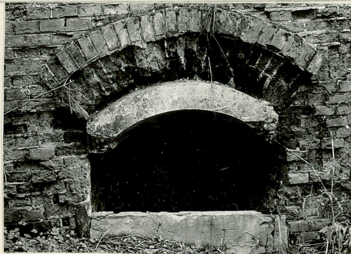
18 otwór okienny