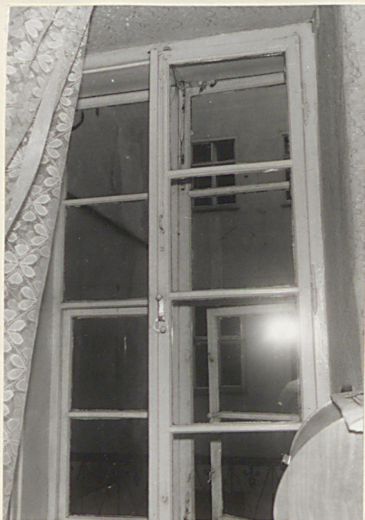
Okno pomieszczenia na I p. d. oficyny zach.