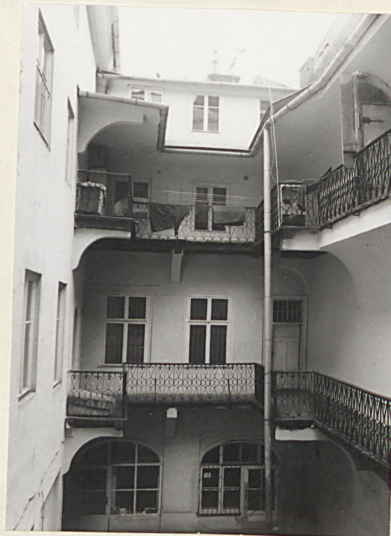
elewacja d. oficyny wsch., widok z I p. budynku fron- towego