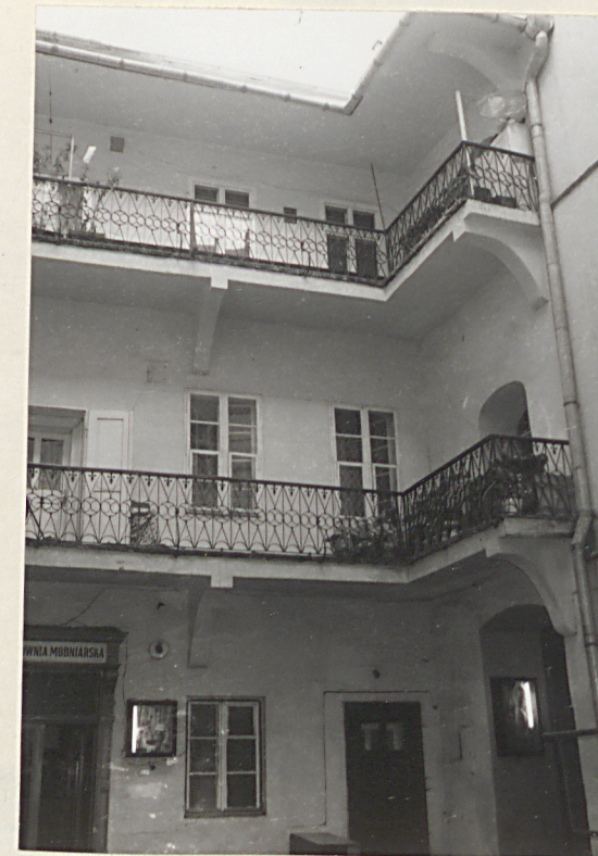
elewacja d. oficyny zach.; z prawej fragment zach. ele- wacji łącznika /d. oficyna boczna/, z przejściem do wsch. podwórka

Wkładkę założył: Waldemar Komorowski, 1988.10