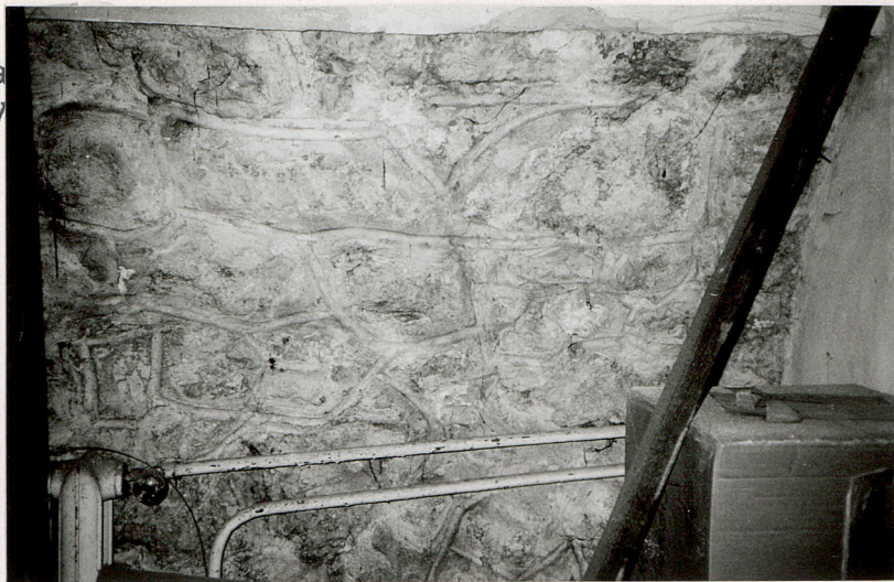
kamienny wątek ścia- ny piwnicy w narożni- ku wsch.