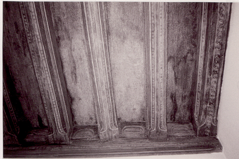
fragment stropu w pom. narożni- ka wsch., I p.