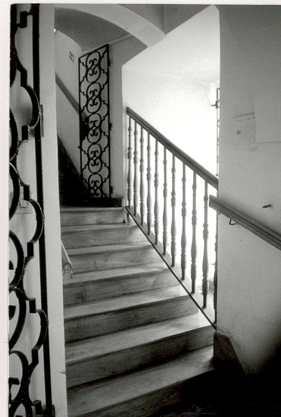
wejście z sieni do klatki schodowej