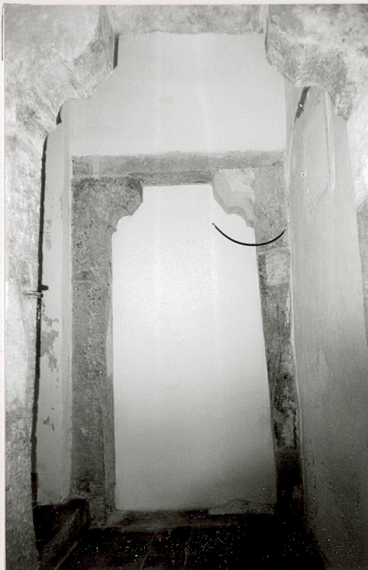
2. foto obok portal w zach. ścianie apteki