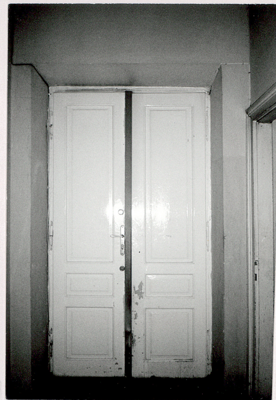
stolarka drzwiowa wewnętrzna