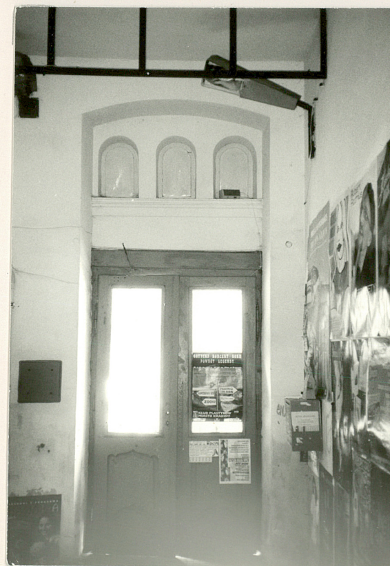
wejście główne od strony sieni