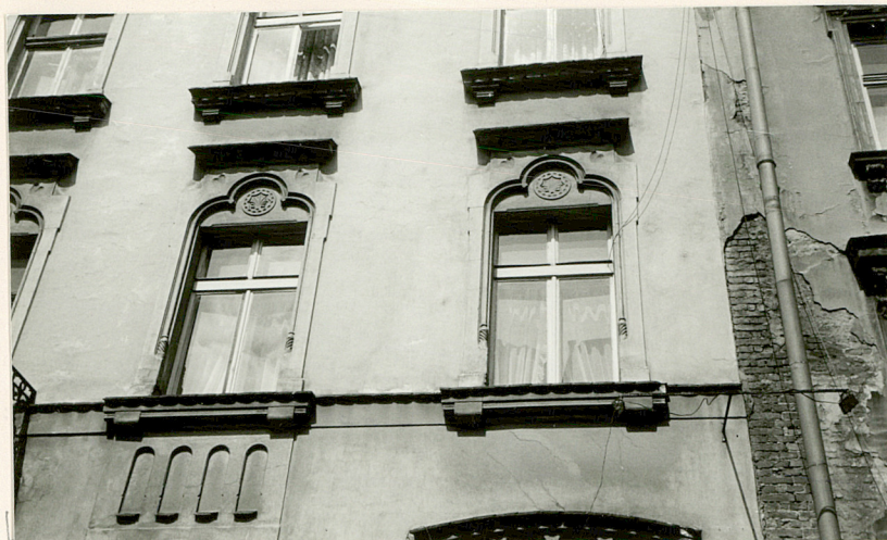
fragment ele- wacji fronto- wej