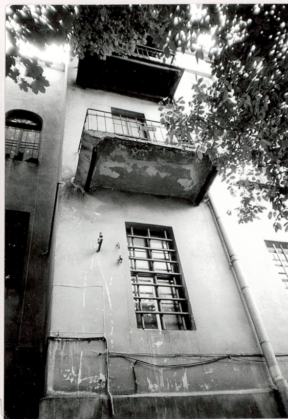
ryzalit, fragment ściany