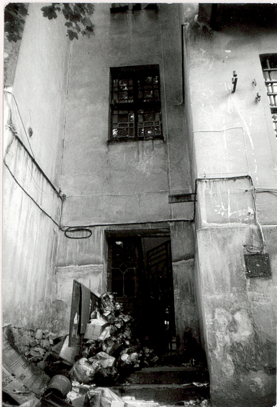
elewacja tylna w osi sieni