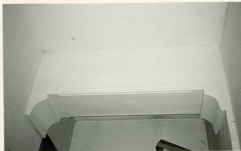
sień, gurt sklepienny