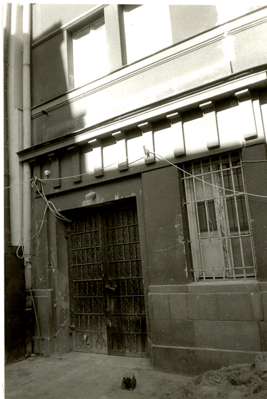
wejście od pd., od ul. Mi- kołajskiej