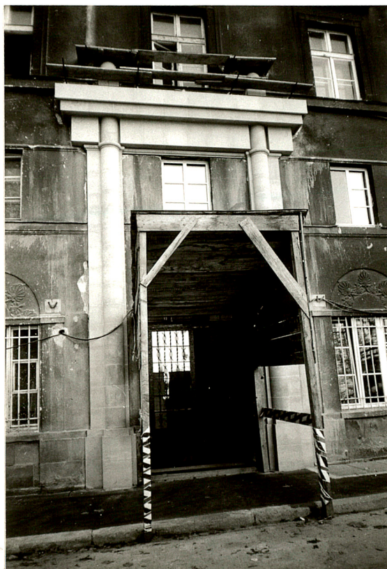
portal w wejściu głównym od pn., od ul. św. Tomasza