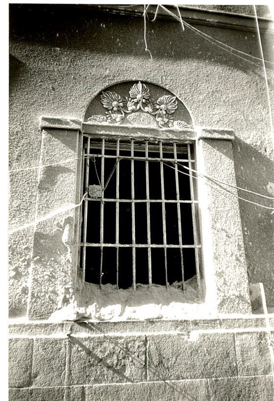
obramienie okienne w parterze