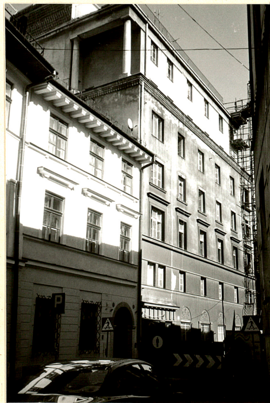
budynek w widoku od pd. od ul. Mikołajskiej