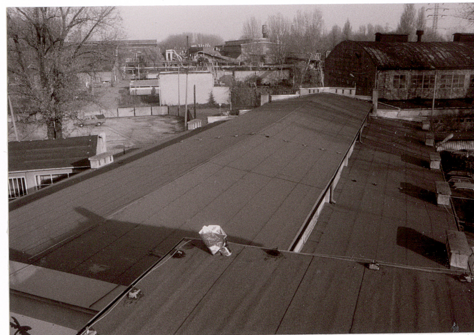
BUDYNEK GŁÓWNY :