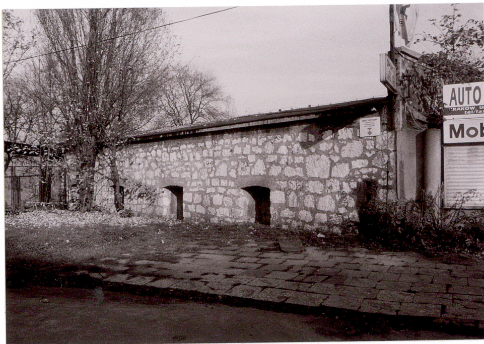
WIDOK OD ULICY