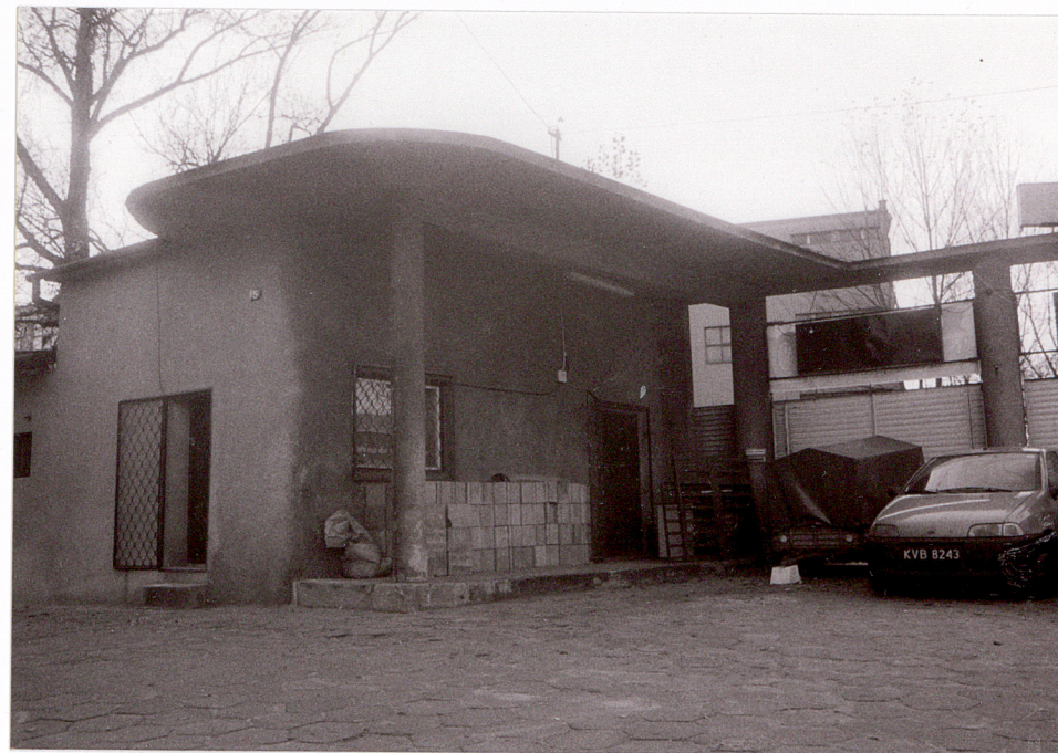
DAWNA STACJA BENZYNOWA; Z PRAWYJ: BRAMA