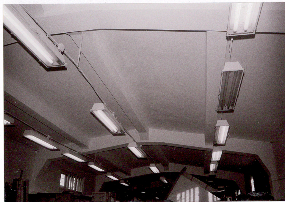
KONSTRUKCJA : FRAGMENT, GÓRNA KONDYGNACJA GARAŻU