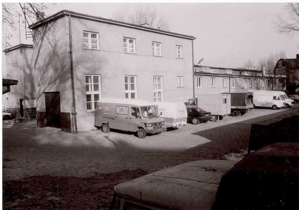
WIDOK CAŁOŚCI OD PŁD. ZACHODU