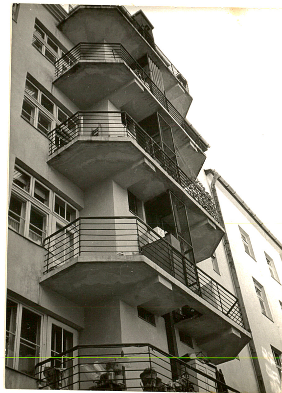
3. Elewacja podwórzowa - obudowa ciągu kominowego pomiędzy posesjami 24 i 26 w formie ceglanej lizeny