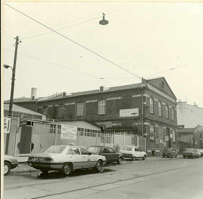
budynek administracyjno- produkcyjny