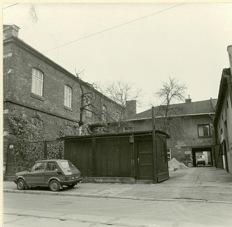
budynk administracyjno- produkcyjny (z lewej) i budynek mieszkalny