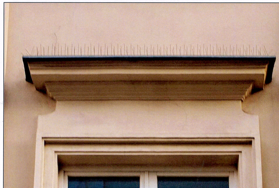
Zwieńczenie okna 1 piętra od ul. Szpitalnej