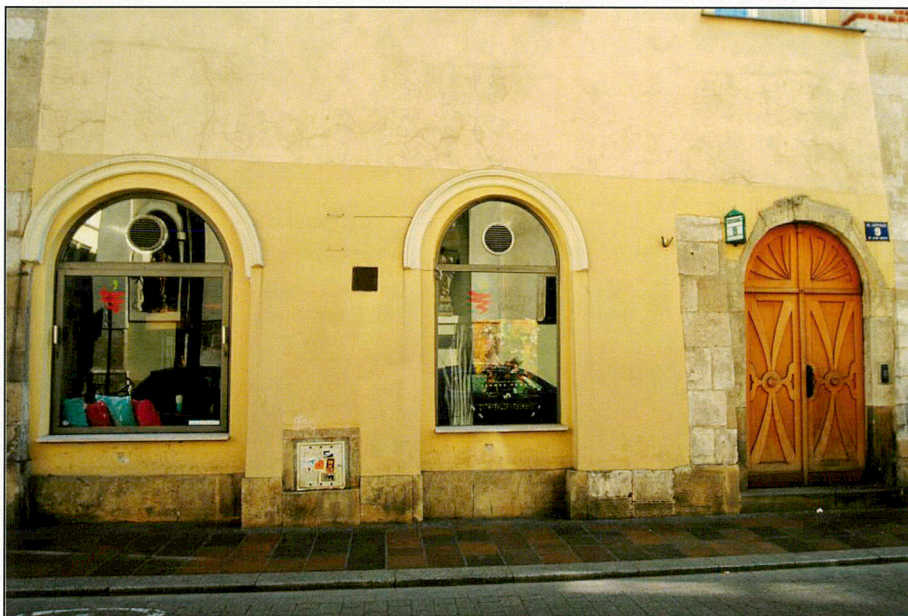
Elewacja od ul. Szpitalnej – pas parteru