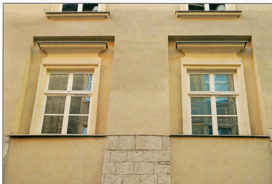
Elewacja od ul. św. Tomasza – okna 1 piętra