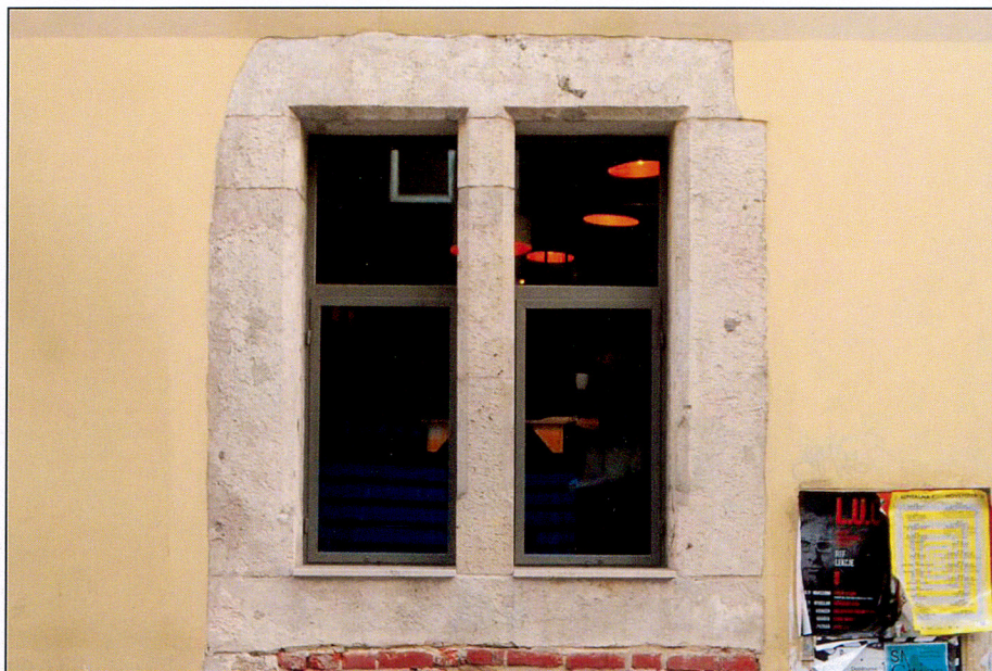
Okna parteru od ul. św. Tomasza