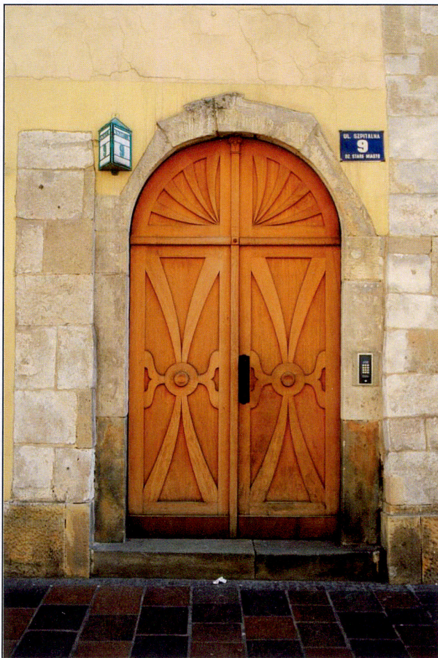
Brama wejściowa od ul. Szpitalnej