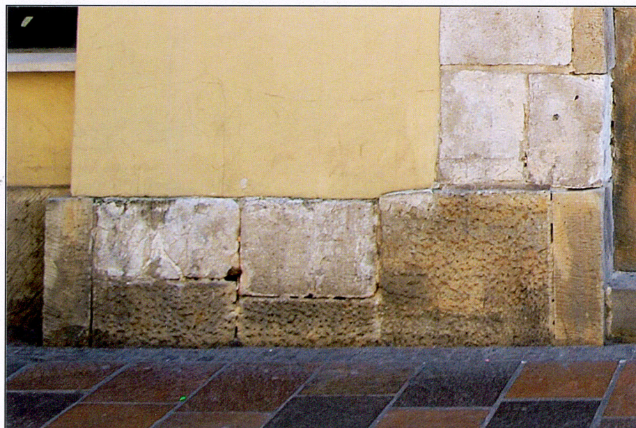
Detal cokołu od ul. Szpitalnej