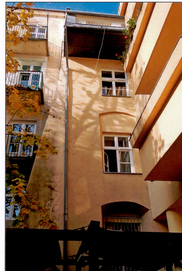
Elewacja tylna od ul. Szpitalnej