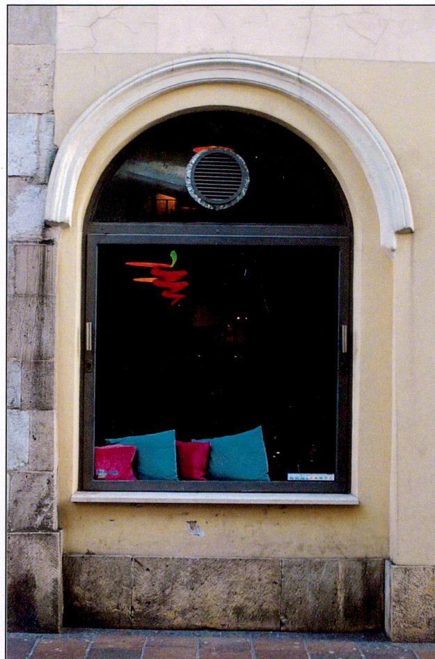
Oś skrajna pn parteru od ul. Szpitalnej