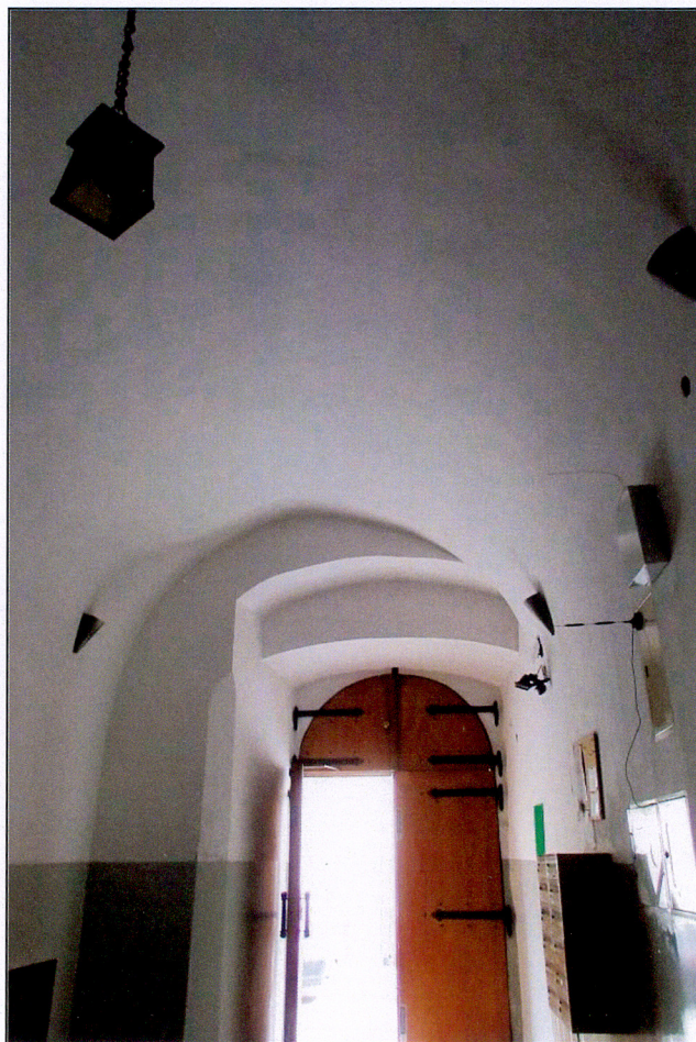
Sień od ul. Szpitalnej