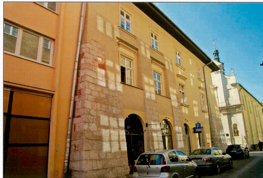
Elewacja od ul. św. Tomasza