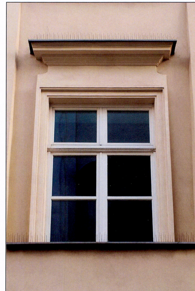
Okno 1 piętra