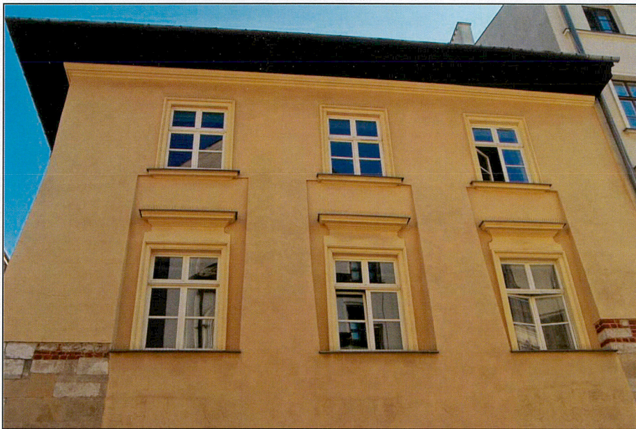
Elewacja od ul. Szpitalnej 1 i 2 piętro