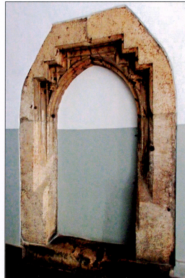
Portal w sieni