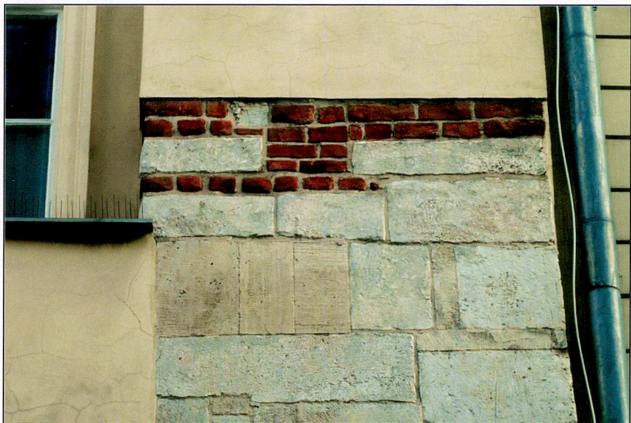
Zwieńczenie skarpy pd od ul. Szpitalnej