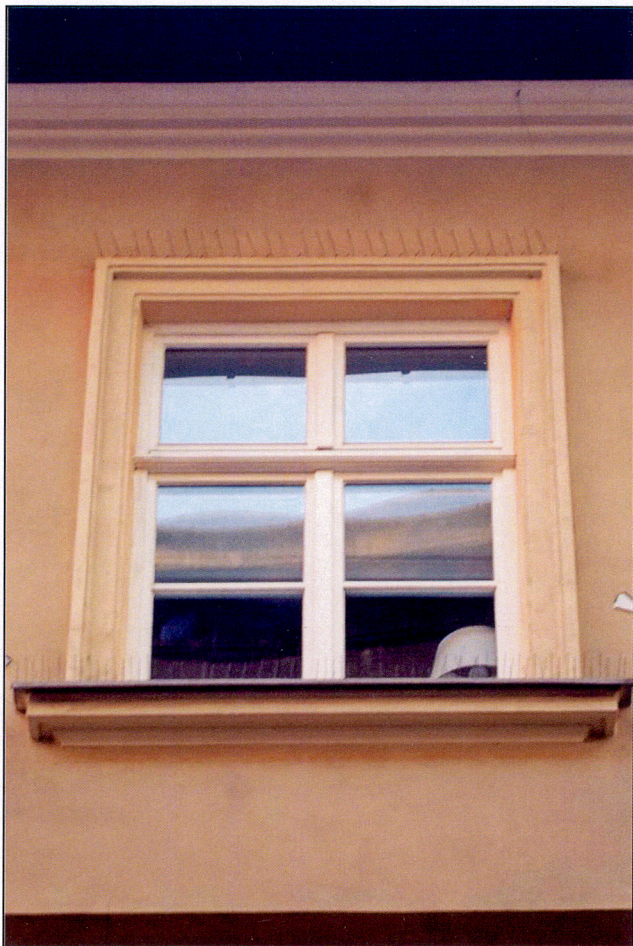
Okno 2 piętra