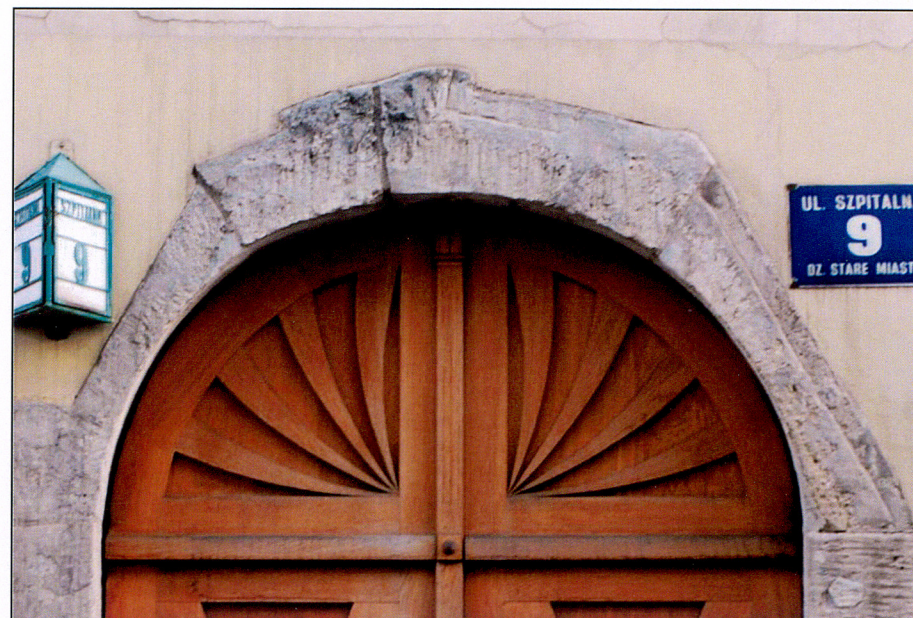
Zwieńczenie bramy głównej od ul. Szpitalnej