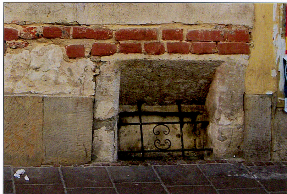
Okienko piwniczne od ul. św. Tomasza