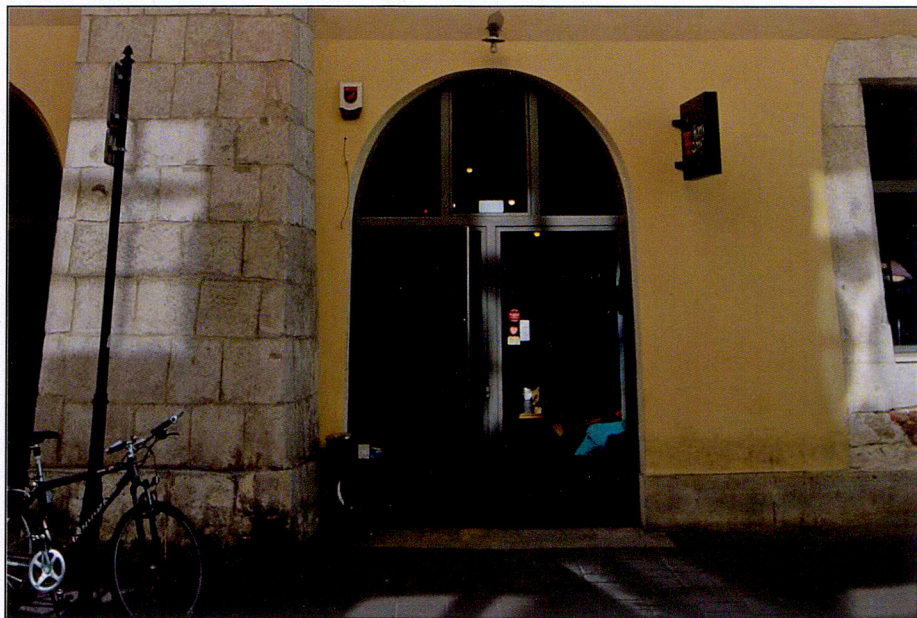
Wejście do lokalu od ul. św. Tomasza