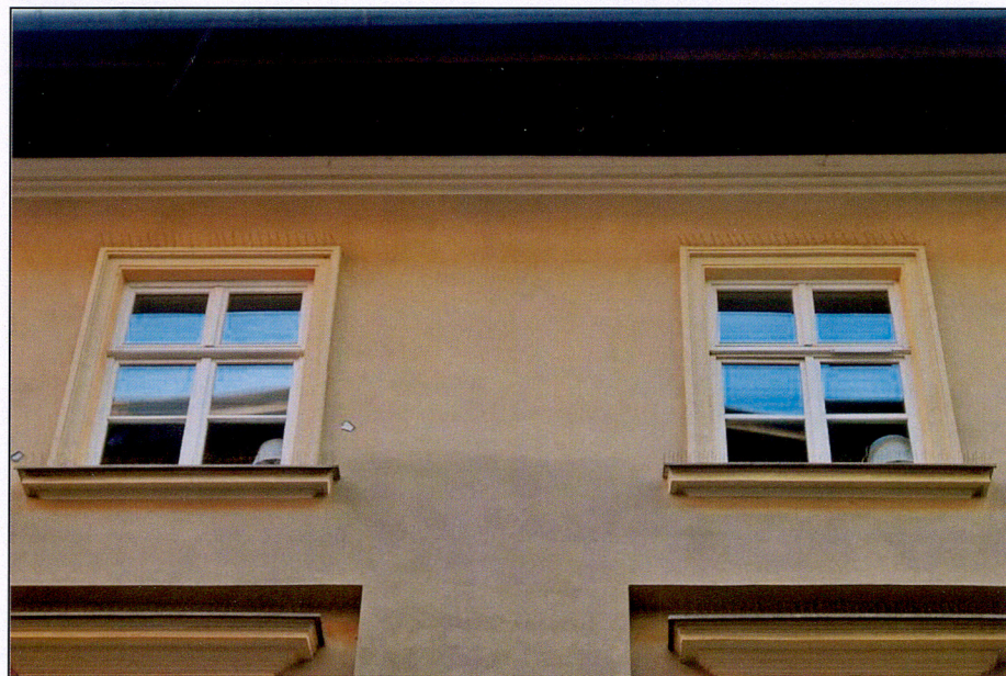
Okna 2 piętra od ul. św. Tomasza