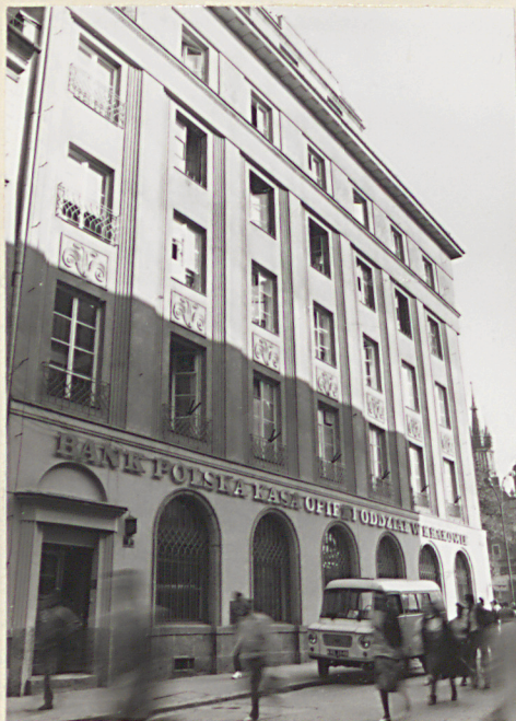
elewacja od strony ul. Szewskiej, widok od pd.-zach.