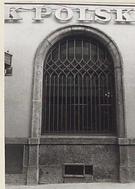
okno na parterze elewacji od strony ul. Szewskiej