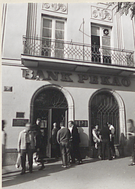
elewacja od strony Rynku Gł.; parter i I p.