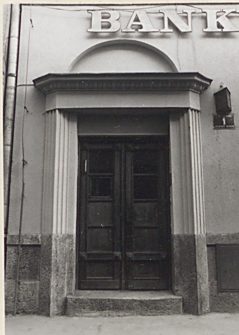
wejście z ul. Szewskiej