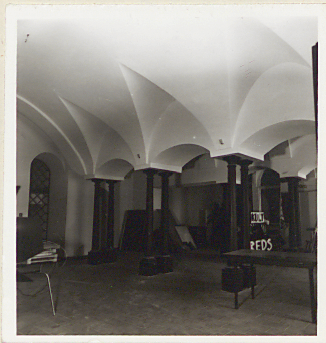
Pomieszczenie we frontowej części traktu frontowego, widok od pn.-wsch.

kolumna (XVI w) i arkadowe wnęki w ścianie na I p.; filar z głowicą wspornikową, gotycki, na II p. Stolarka nowa, wzorowana na starej: drzwi płycinowe, jedno- i dwuskrzydłowe, z profilowanymi obramieniami, niektóre z gzymsami. Główna klatka schodowa urządzona została w XIX w., schody i obecna dekoracja pochodzą z pocz. XX w. Ściany w partii parteru pokryte płaskim boniowaniem pasowym, na wyższych kondygnacjach ramowymi podziałami z profilowanych pasów. Stolarka drzwi klatki schodowej ozdobniejsza niż innych pomieszczeń. Instalacje: elektryczna, wodno-kanalizacyjna, gazowa, centralnego ogrzewania.