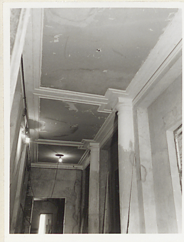
korytarz przy sali widowiskowej, widok od pn.

Wkładkę założył: Walde mar mar Komorowski, XI 1990 r. (imię, nazwisko, data)