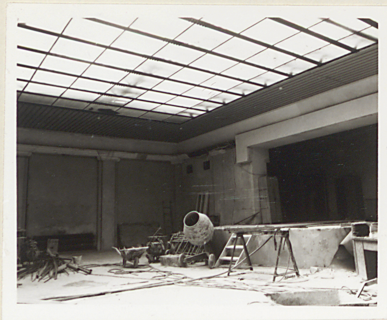
sala widowiskowa, część pd.-wsch.

12. W l. czterdziestych adaptowano budynek dla potrzeb NSDAP; urządzono salę widowiskową.