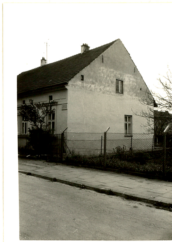
Ściana szczytowa pld.-wsch.