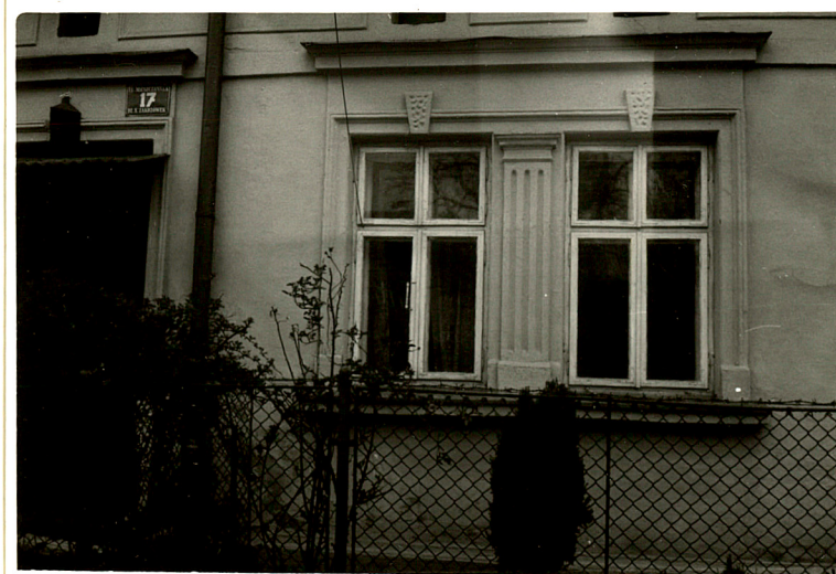
Elewacja frontowa - podwójne okna Wzór ODZ 1978 r.