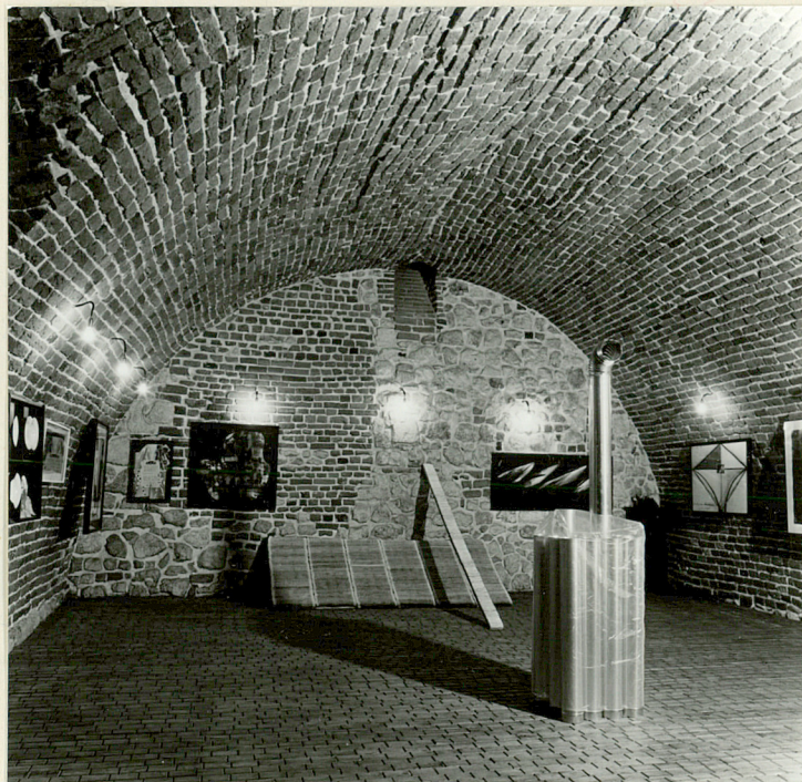
komora piwniczna traktu przyrynkowego