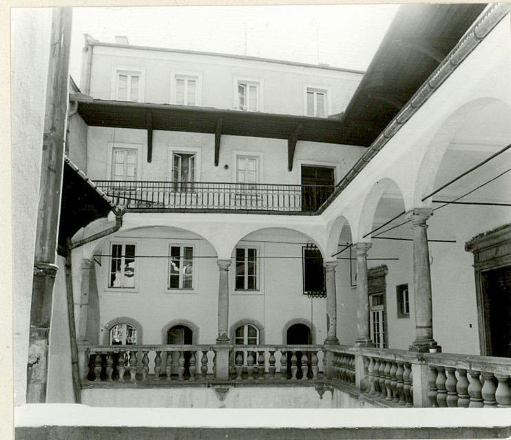
→ krużganki I piętra, część południowa