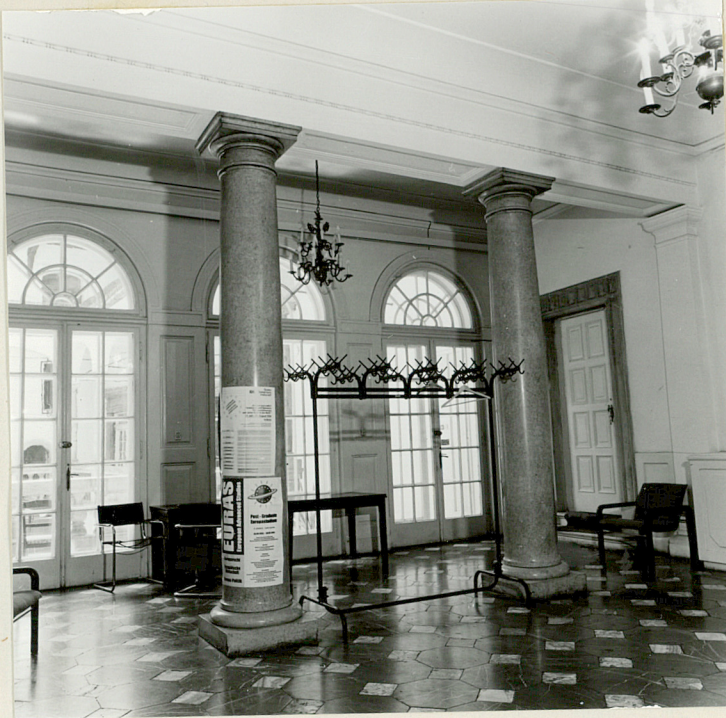
westybul na I piętrze