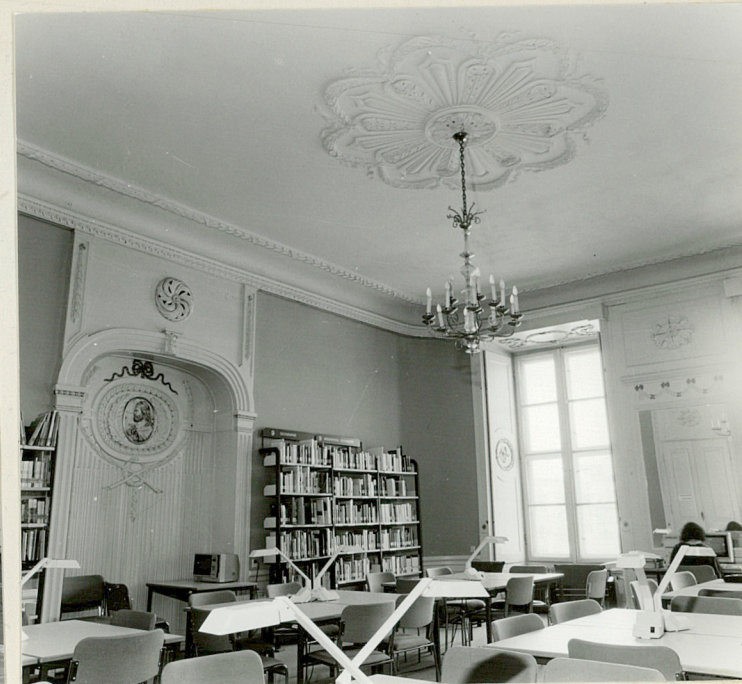
salon narożny I piętra