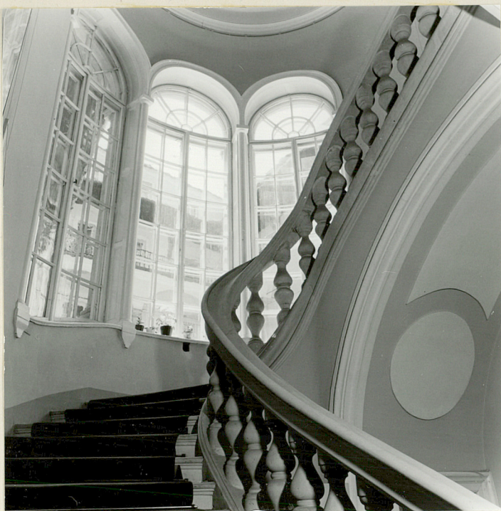
reprezentacyjna klatka schodowa