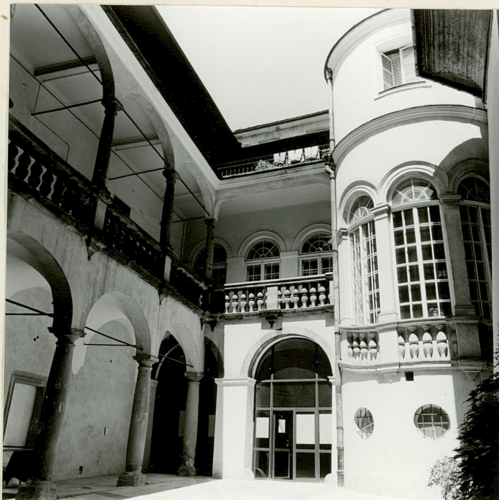
← dziedziniec, część północna