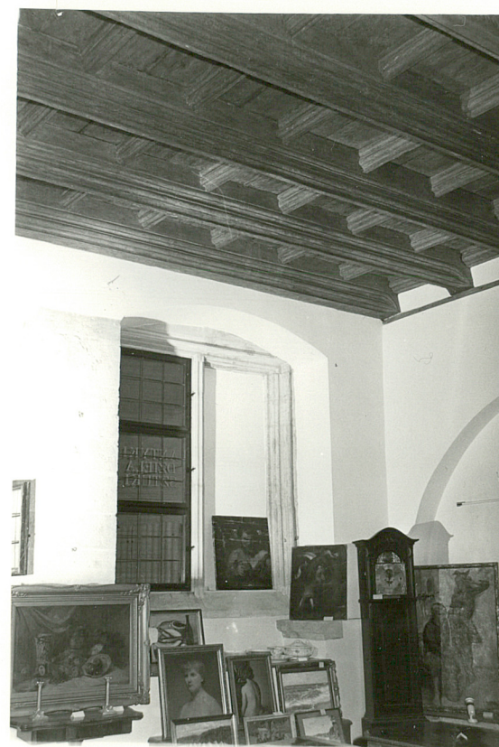
strop i okno d. izby tylnej