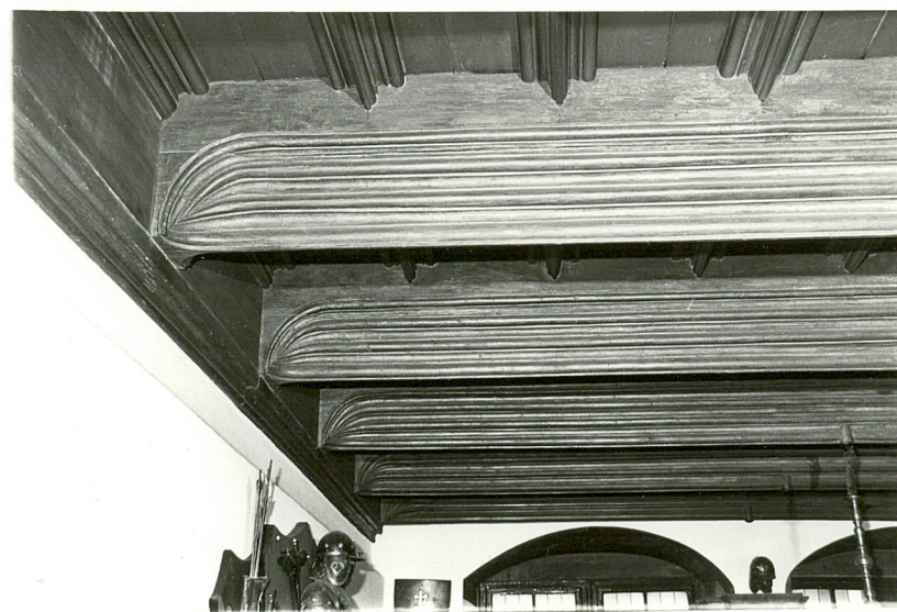
strop "Sali Rycerskiej"