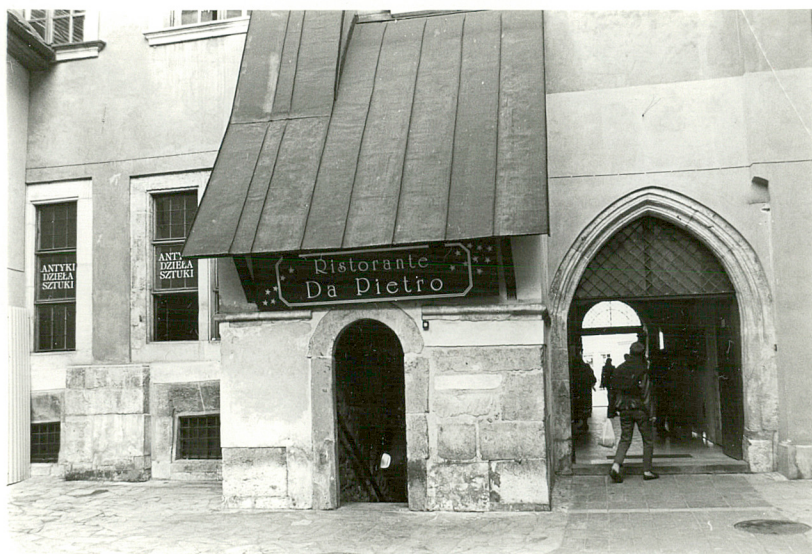
parterowa część elewacji tylnej