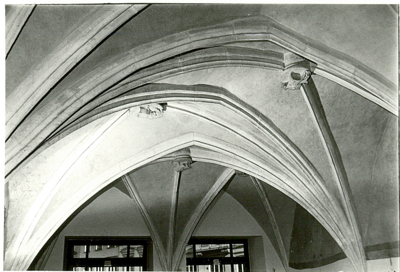
sklepienie "Sali Hetmańskiej"

Plan zabudowy Rynku krakowskiego z 1787 r., D.Pucek (wg S.Tomkowicz, Ulice i place Krakowa w ciągu dziejów ..., Biblioteka Krakowska nr 63-64, Kraków 1926.