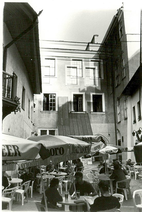
← Podwórzec - widok od zach. W głębi budynek frontowy I, po lewej oficyna boczna pn., po prawej oficyna boczna pd.