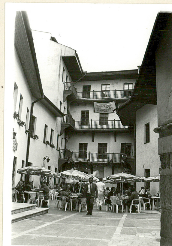
→ Podwórzec - widok od wsch. W głębi budynek frontowy II, po lewej oficyna boczna pd., po prawej oficyna boczna pn.